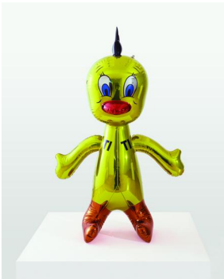
KOONS, Jeff. Titi . 2004 – 2009, espelho e aço inoxidável com revestimento de cor, 96,2 x 60,5 x 37,8 cm. Londres: New Port Gallery. © Jeff Koons