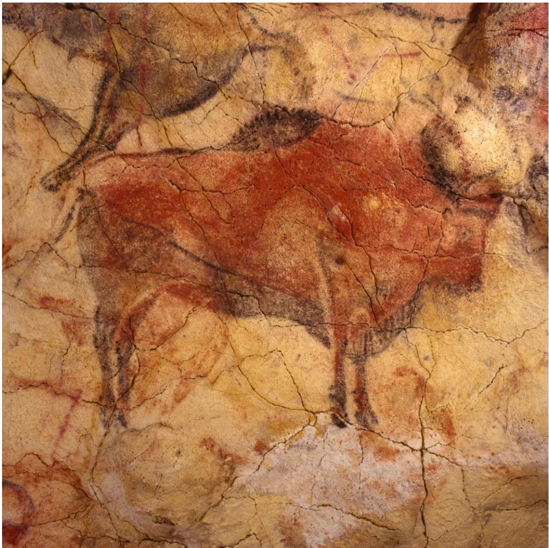
Bisão . 18.380 – 16.179 (período magdaleniano). Museo de Altamira, Espanha.