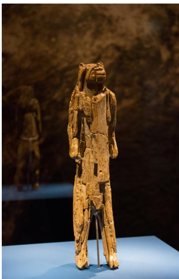
IMAGEM 1 – HOMEM-LEÃO

Homem-leão . 35 – 40.000 anos (período aurignaciano). Marfim de mamute. Pertence ao acervo de arqueologia do Museu de Ulm, Alemanha.