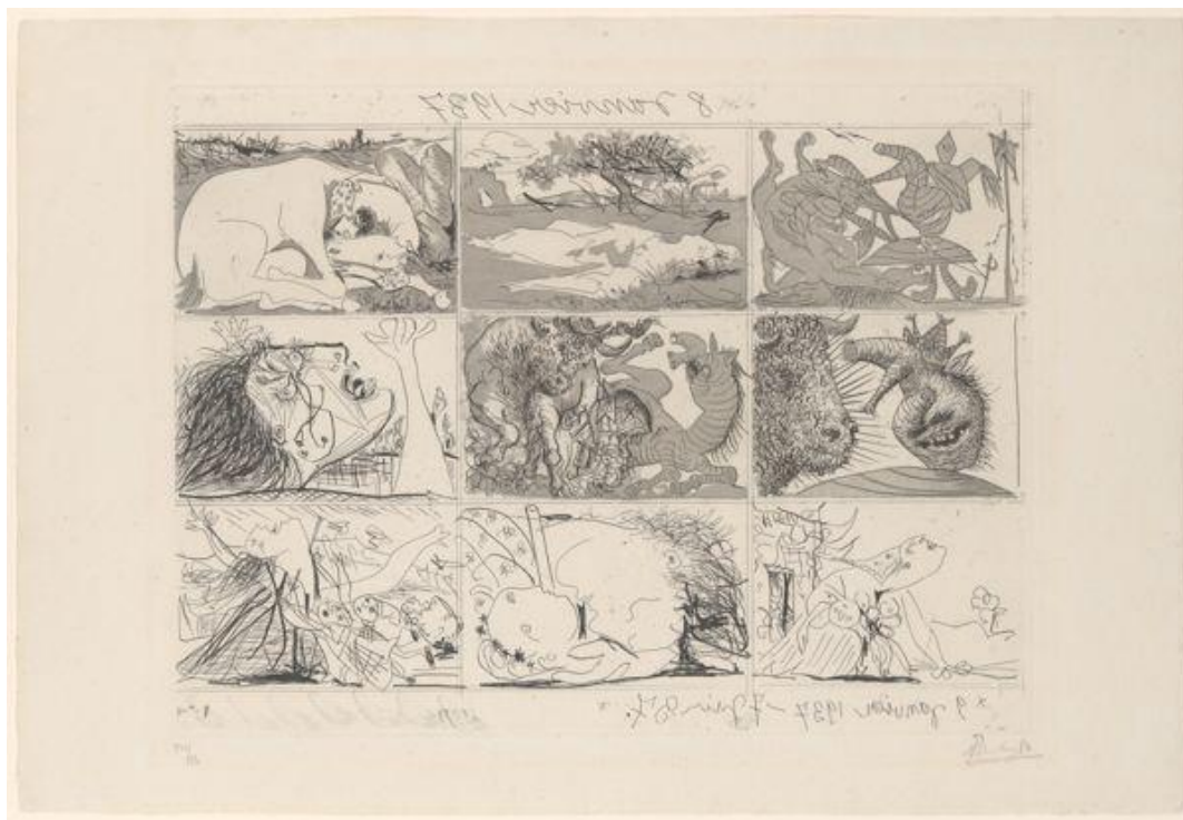
IMAGEM 7 - SUEÑO Y MENTIRA DE FRANCO II

©2018 Estate of Pablo Picasso/Artists Rights Society (ARS), New York.