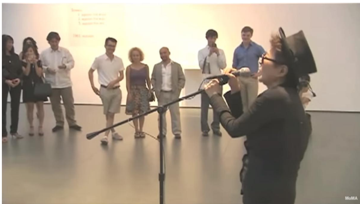
ONO, Yoko. Voice piece for soprano . Nova York: junho de 2010. Performance no Museum of Modern Art. © 2010 The Museum of Modern Art, New York

O público que aplaudiu Voice Piece for Soprano é o mesmo que Yoko satiriza, por estar justamente aplaudindo algo que não merece aplausos. Esse exemplo desperta um razoável elemento de dúvida sobre a trivialidade dessa arte e no interesse do público pela provocação irônica da artista. Por mais sátiras das condições do mercado de arte que os artistas realizem, é sob tutela deste mercado que eles sobrevivem. Alegam como liberdade criadora o que na verdade é uma servidão às galerias e grandes corporações que lucram o controlam os aparentes rebeldes artistas que não oferecem risco algum à ordem, ao contrário, alimentam este mercado para em troca serem gratificados em exposições que não conseguem