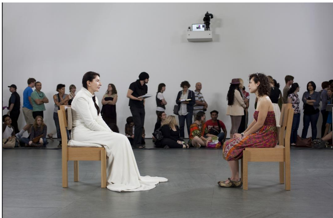
ABRAMOVIC, Marina. The Artist is Present . Nova York, MoMa: 14 de março – 31 maio de 2010. IN2112.132.

Abramovic tenta estabelecer uma relação entre o artista e o público sem a mediação da obra de arte e sem a mediação da própria atividade artística. No limite, ela tenta estabelecer uma relação humana despida de mediações, tentativa que não pode ser bem-sucedida, pois não existe a “pura presença”, ninguém tem apenas “sua energia e nada mais”. A artista, que iniciou sua carreira desenvolvendo trabalhos que buscavam questionar os valores tradicionais da arte e do circuito artístico vigente em museus e galerias, hoje atua no sentido inverso ao se destacar como uma celebridade.