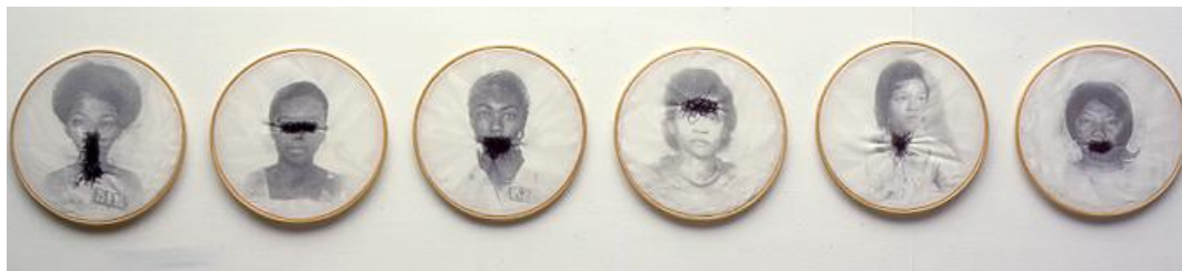
PAULINO, Rosana. Sem título. São Paulo: 1997. xerografia e linha sobre tecido montado em bastidor 31,3 x 310 cm. Pertence atualmente ao acervo do Museu de Arte Moderna de São Paulo – MAM.

No trabalho The Physical Impossibility of Death in the Mind of Someone Living - A Impossibilidade Física da Morte na Mente de Alguém Vivendo - (1991), o artista britânico Damien Hirst (1965 - ), considerado um dos mais importantes e mais ricos artistas do mundo, busca uma representação da ideia da morte como algo assustador por meio da imagem de um o tubarão-tigre conservado em formol dentro de uma caixa de vidro (imagem 9). Hirst pretende forçar o público a encarar o tubarão, que parece vivo, na tentativa de provocar uma reflexão sobre encarar o medo da morte.