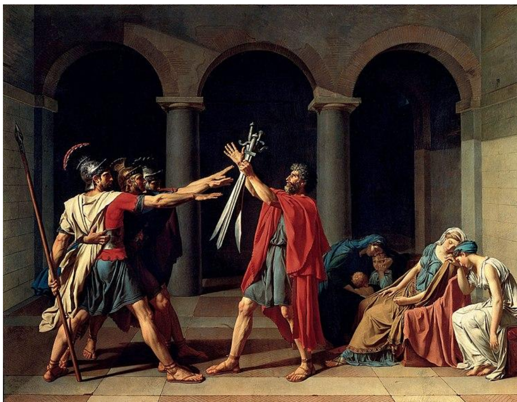
DAVID, Jacques Louis. O Juramento dos Horácios . Paris: 1784. Óleo sobre tela, 330 cm x 425 cm. Pertence atualmente ao Museu do Louvre.