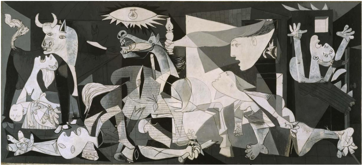
PICASSO, Pablo Ruiz. Guernica . Paris: 1 de maio – 4 de junho de 1937. Óleo sobre tela, 3,49 m x 7,76 m. Pertence atualmente ao acervo do Museo Nacional Reina Sofia.