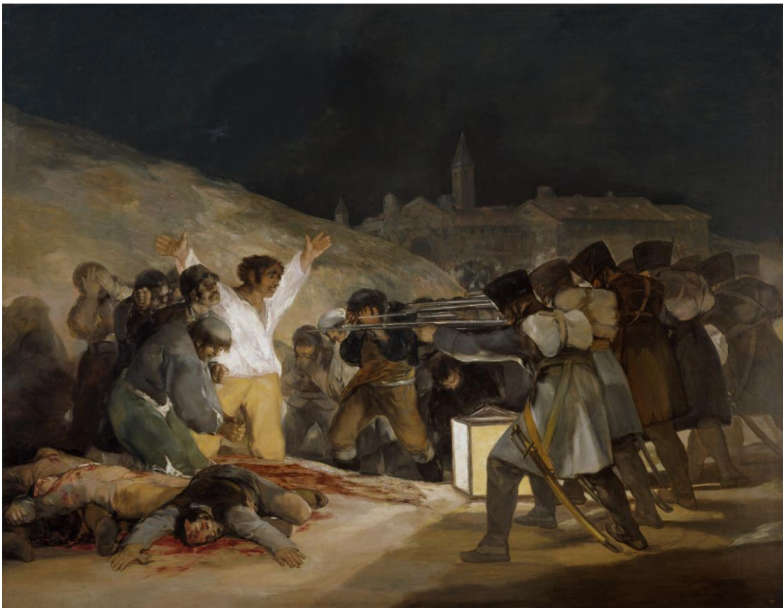
GOYA Y LUCIENTES, Francisco de. El 3 de mayo de 1808 en Madrid o "Los fusilamientos" . Madrid: 1814. Óleo sobre tela, 2,68 m x 3,47 m. Pertence atualmente ao Museo Nacional del Prado.