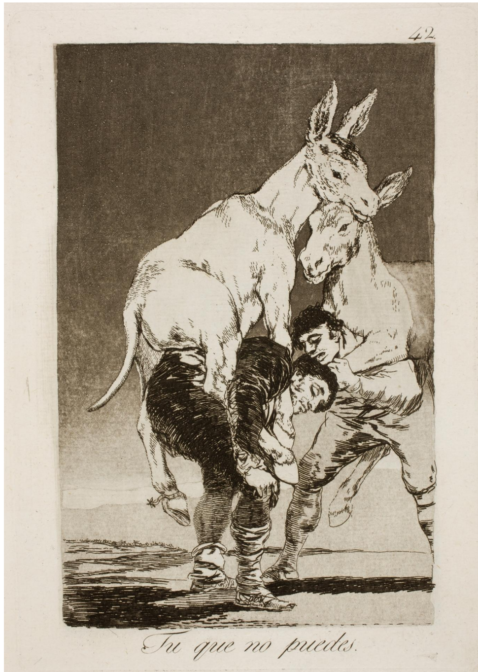
GOYA Y LUCIENTES, Francisco de. Tu que no puedes . 1ª edição, Madri: 1799. Água-forte e água-tinta polida, 21,3 cm x 15,2 cm. Pertence atualmente ao acervo do Museo Nacional del Prado.

As tormentas do obscuro, a fraqueza, a loucura comum e a insensatez, servem ao artista, e não o contrário. A paixão não dominou Goya porque ele tinha plena consciência de suas escolhas e elas aparecem nas anotações de seus desenhos – os que sobreviveram – antes