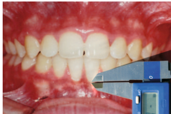
FIGURA 1 - Medição da recessão.

Para se avaliar o erro metodológico na localização dos pontos e da sobreposição radiográfica, 10 cefalogramas randomicamente selecionados foram