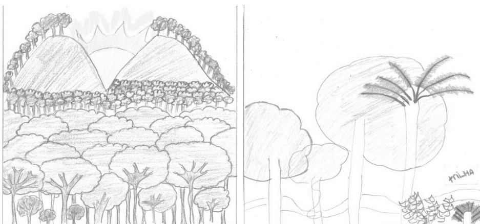
Figura 2 – Representações da floresta feitas por um mesmo aluno da 6ª D após aula teórica e aula prática de campo, respectivamente.

Após aula prática de campo, notou-se maior dificuldade de representação de floresta. No entanto, houve também maior preocupação com os elementos a serem representados, não se restringindo tanto aos aspectos visuais e à organização desses elementos, como o observado anteriormente.