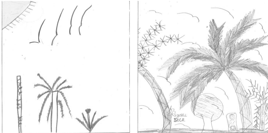
Figura 3 – Representações da floresta feitas por um mesmo aluno da 6ª C após aula prática de campo e aula teórica, respectivamente.

Analisando-se a seqüência inversa de atividades (6ª C), representações com características muito semelhantes àquelas descritas acima, após o contato com o ambiente natural, foram observadas. Poucos elementos representados, maior diversidade de espécies e dificuldades de representação da floresta, uma vez constatada a complexidade desse ambiente, são encontrados nas figuras 3 e 4.