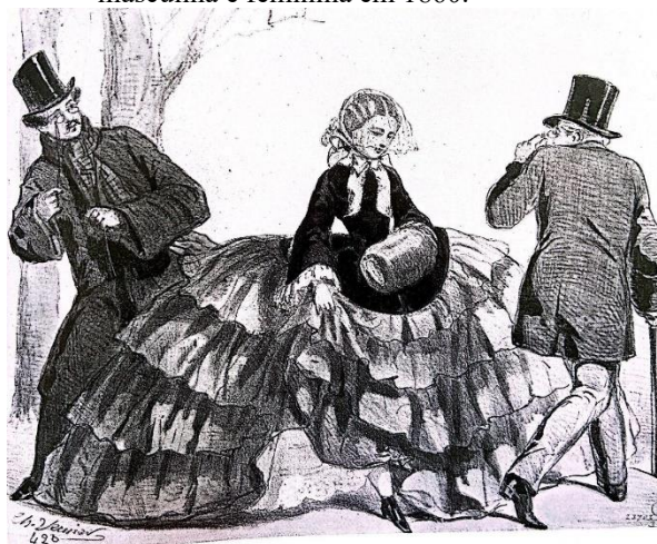
Figura 6: “Um andar para virar todas as cabeças!”, de Charles Vernier. A diferença da silhueta das roupas masculina e feminina em 1860.