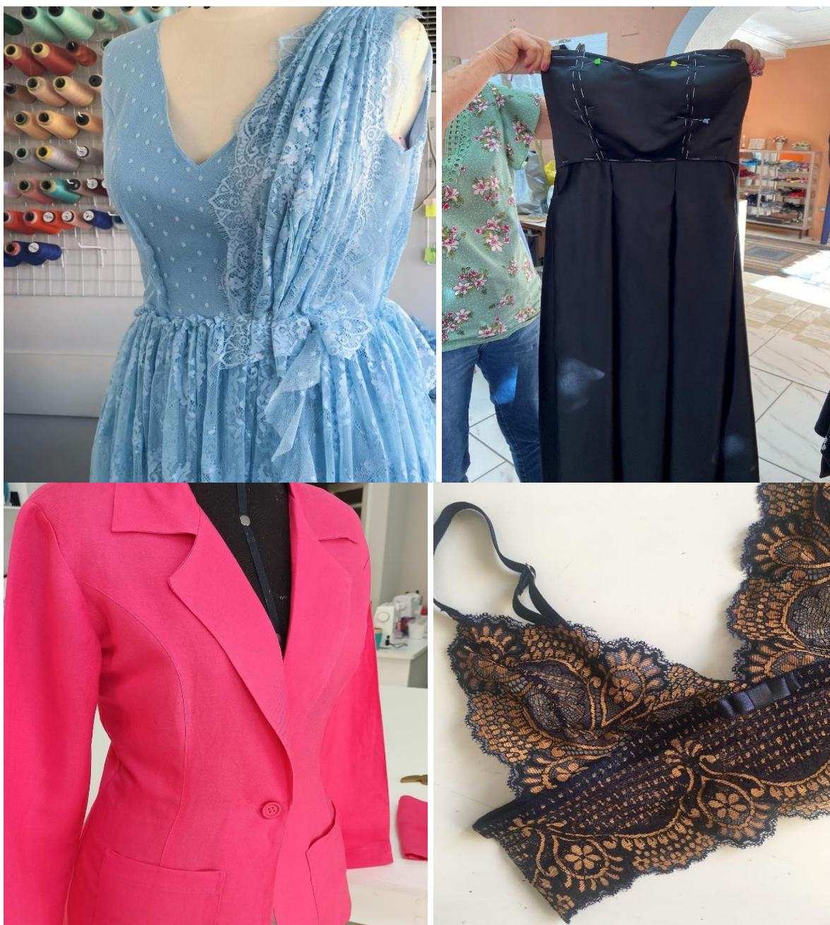
Figura 18: Blazer feminino por Ana e Lucélia; Sutiã de renda por Camila; Vestidos de festa em confecção por Andréa e Fátima, respectivamente.