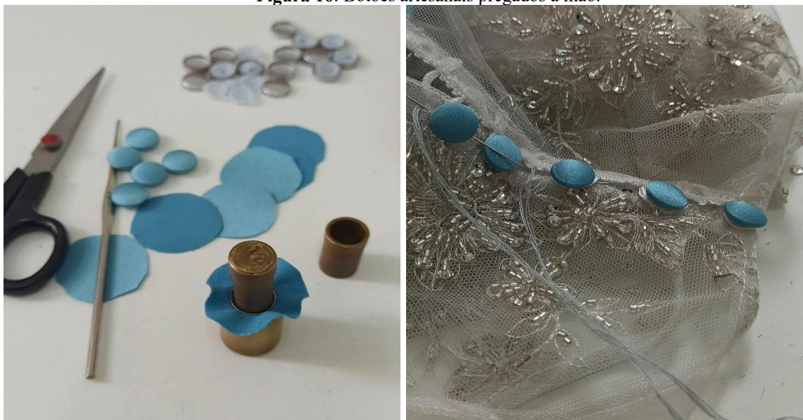
Figura 16: Botões artesanais pregados à mão.