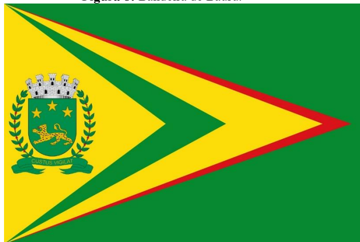
Figura 8: Bandeira de Bauru.

Fonte: Prefeitura Municipal de Bauru (2023) 26 .