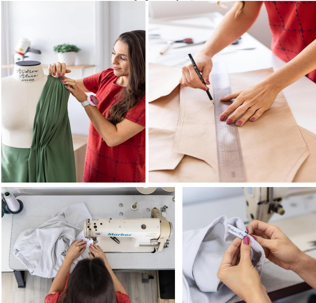
Figura 15: Técnicas Modelagem Tridimensional, Modelagem Plana, Costura na máquina e Costura à mão (pregando etiqueta).