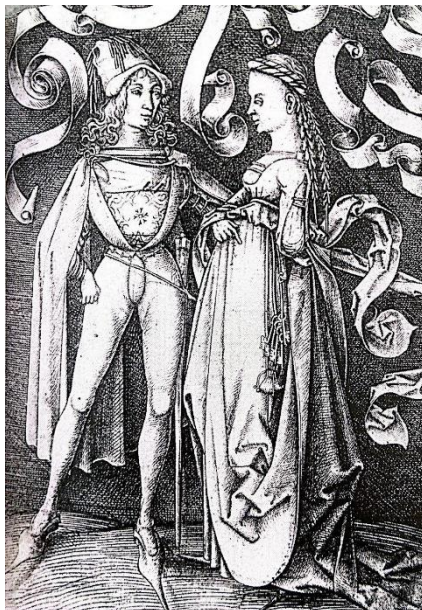
Figura 1: Gravura de Israel van Meckenem mostrando a moda italiana em 1470.