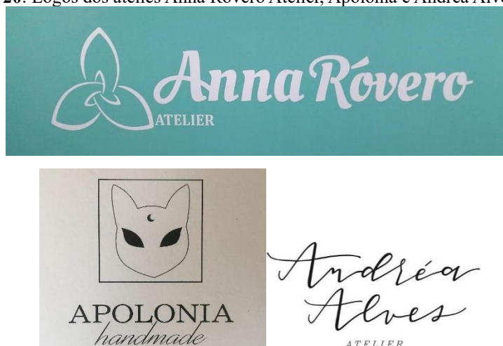
Figura 20: Logos dos ateliês Anna Róvero Atelier, Apolonia e Andréa Alves Atelier.