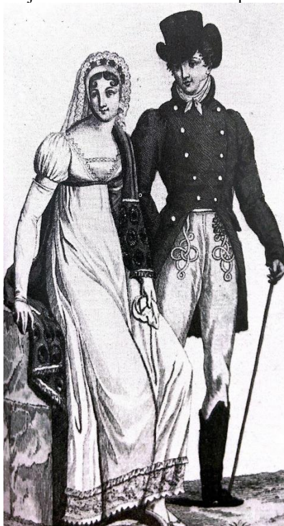
Figura 2: Trajes masculino e feminino de passeio em 1810.

corajosa. Os homens passaram a se vestir com casacos de lã escuros e trajes que simbolizavam a sensação de probidade, comedimento e prudência. Enquanto isso, as mulheres eram vestidas pelas modistas em vestidos de musselina e caimento maleável.