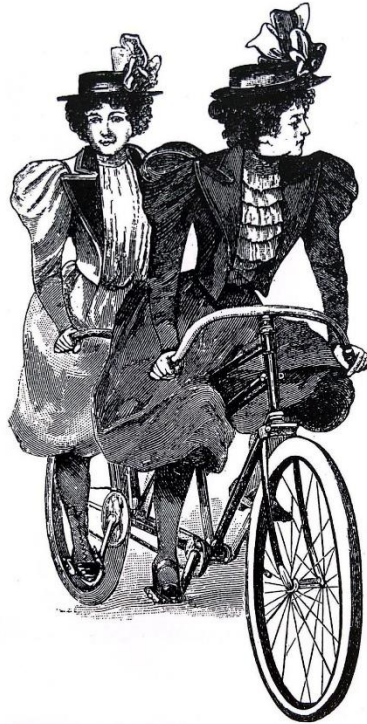
Figura 4: Traje para ciclismo em 1894. Destaque para os calções largos chamados bloomers.