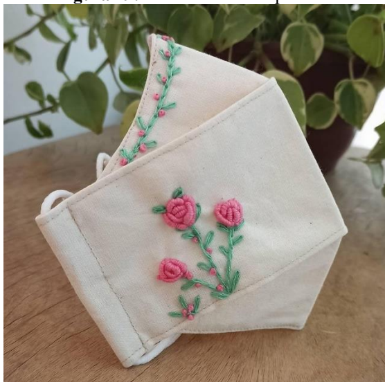
Figura 19: Máscara bordada por Ana.

as contas da casa e enfrentar os obstáculos da época.