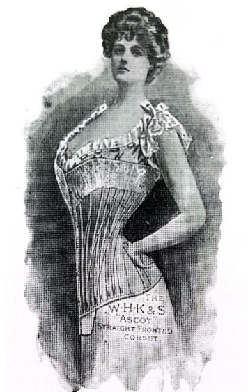
Figura 3: Espartilho de frente reta que resultava na silhueta S em 1902.

No final do século XIX e início do XX, estende-se a época denominada “ la belle époque ”, a qual evocava demonstrar o poder de grupos sociais elevados, nos quais a riqueza “era especialmente evidente nas luxuosas roupas femininas” (MENDES; HAYE, 2003, p. 02). De acordo com Laver (2003, p. 213-216), foi um período de ostentação e extravagância em que se gastava com bailes, jantares e festas. Mediante o vestuário, as mulheres tinham o busto enfatizado pelos “[...] espartilhos ‘saudáveis’ que num esforço louvável para evitar a pressão sobre o abdômen, tornava o corpo rigidamente ereto na frente, levantando o busto e jogando os quadris para trás. Isso produzia a postura peculiar em forma de S tão característica da época.”