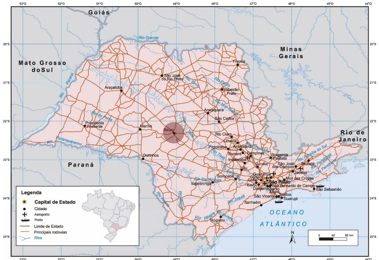
Figura 7: Localização de Bauru em São Paulo.