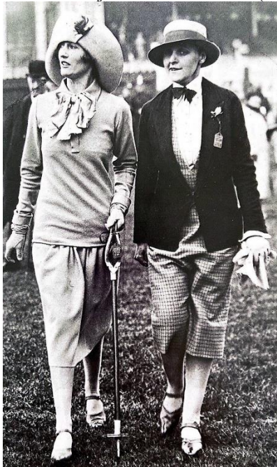
Figura 5: Elementos masculinos no traje feminino em 1926 (Chester, Inglaterra).