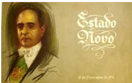
Figuras 2A e 2B – Capa e folha de rosto do livro Catecismo cívico do Estado Novo , sem indicação de autoria, editado pelo DNC.