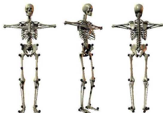
Figura 2: Posicionamento dos marcadores reflexivos esféricos nas regiões anatômicas descritas para mensuração da cinemática articular.

Para sincronizar as duas câmeras no domínio do tempo, foi utilizado um foot-switch no solado do tênis, na região do primeiro metatarso do executante, o qual, ao ser comutado, acionava dois sinalizadores luminosos posicionados no campo de captura das duas câmeras. Esses sinais também foram utilizados