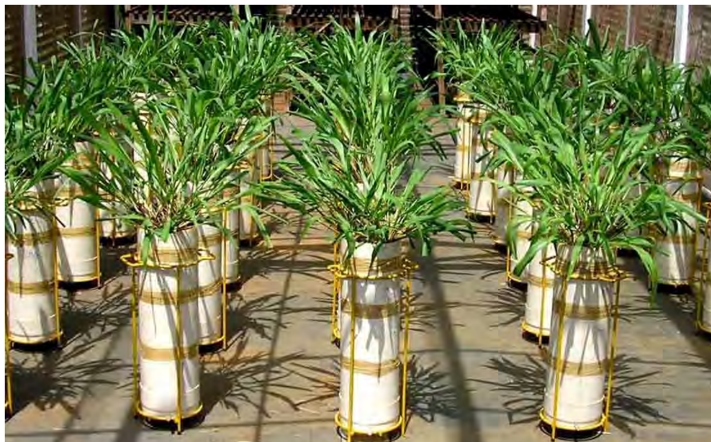
Figura 1. Aspecto geral do experimento na casa de vegetação, uma semana após o primeiro corte.

O segundo corte de plantas foi feito 30 dias após o primeiro, e, em seguida, foi feita a última aplicação de lodo na superfície do solo das colunas e o experimento foi conduzido por mais 35 dias, quando foi colhida a parte aérea do capim fazendo-se o corte rente ao solo.