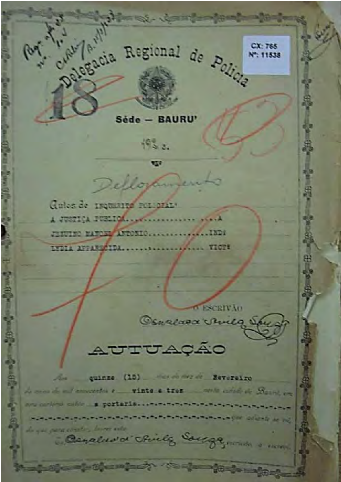
Figura 1: Capa do Inquérito Policial (CX: 765, Nº 11538)