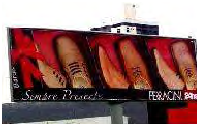
Figura 3 - imagem em que se pode observar a leitura denotativa e conotativa

Geralmente, o indivíduo que procede a uma leitura denotativa (meramente descritiva dos elementos) é rápido, dizendo tudo que tem a dizer em uma única frase ou frases curtas. Já na realização de uma leitura conotativa, geralmente começa-se com “para mim...”, “eu vejo nessa imagem...”, “na minha opinião, a imagem representa...”.