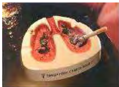
figura 2: a organização dos elementos torna essa propaganda tão eloqüente como um texto visual.

Resumindo, a atividade perceptiva não se constitui em mera recepção da imagem pela visão, mas sim em um processo de compreensão e atribuição de sentido ao que se vê, sendo, conseqüentemente, uma modalidade de leitura.