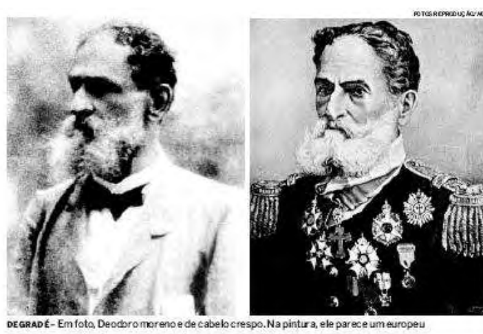
Figura 4 - representação do Marechal Deodoro: à esquerda, sua aparência verdadeira; à direita, mediante retoques, a realidade fabricada.

A figura 4 ilustra como a imagem pode mascarar a realidade. Nela, Marechal Deodoro é retratado como Europeu, disfarçando-se os traços que denunciariam sua descendência mulata. Isso porque naquela época, o Brasil oficial tinha dificuldade de conviver com os negros e mulatos, mais ainda quando estes tinham de ser representados.