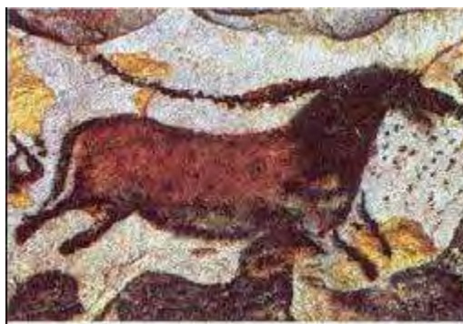
figura 1 - Registro encontrado na Gruta de Lascaux, França

A tinta era produzida com diferentes materiais, como argila, terra misturada com areia, sangue de animais, sumo de plantas, frutos, flores e carvão, sendo o principal material usado para pintar e desenhar as gravuras nas encostas de pedra das grutas e cavernas.