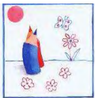
Figura 5 - os lápis História de Amor, p. 10

O livro conta a história de um casal que de início vive feliz, mas que se separa quando um deles passa a ter um envolvimento extraconjugal. Depois de algum tempo, o protagonista masculino, arrependido, tenta retomar a sua antiga relação amorosa. As personagens, representadas por lápis, são caracterizadas pelas cores convencionais indicadoras do gênero masculino e feminino, azul e rosa, respectivamente. Essas cores aparecem em todo o cenário, marcando lugares e momentos vividos pelas personagens.