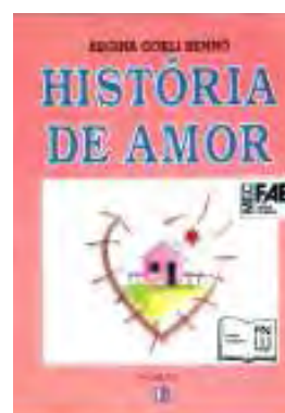
figura 6: capa do livro