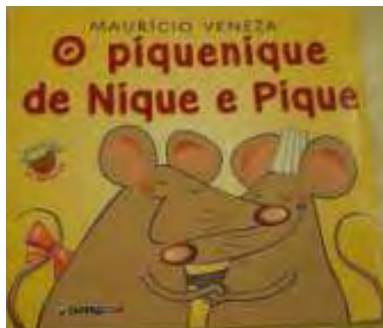
Figura 9 – Capa do livro “O piquenique de Nique e Pique”