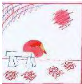
figura 8: marcas gráficas indicadoras de rompimento

“(...) e ela, olhe os riscos, tentou de todas as maneiras tirar esse homem da sua vida, riscar ele de sua existência, pois ele a havia abandonado, trocado por outra...” (profª B)