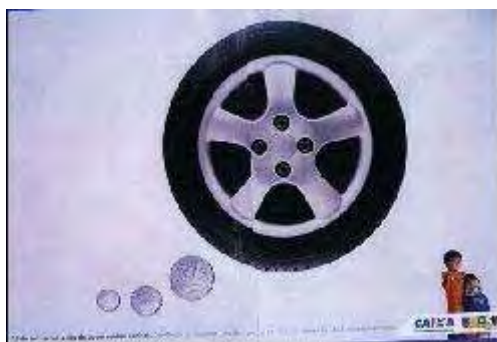
Figura 7 - propaganda da Caixa Econômica Federal (Revista VEJA, 3/11/2004, p. 82.)

A propaganda utilizada diz respeito à caderneta de poupança de um conhecido banco: