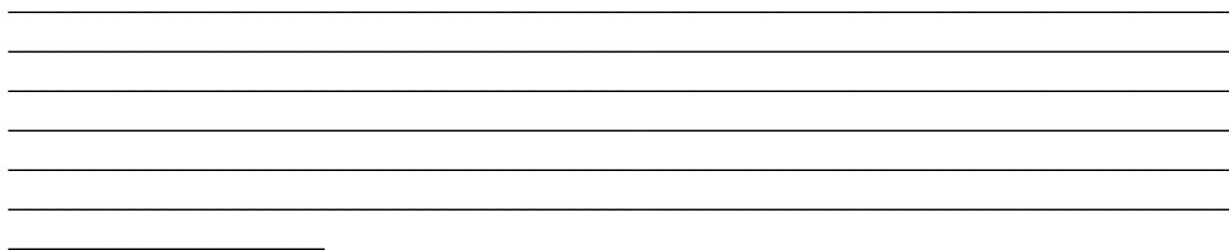
Figura 7 – Tabuleiro de “Jogo da Velha”.