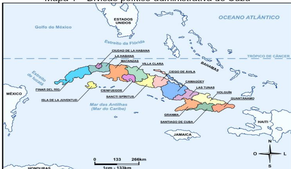
Mapa 1 – Divisão político-administrativa de Cuba