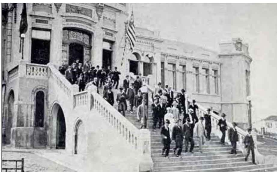
Ilustração 5 – A Escola Normal de São Carlos reuniu nomes ilustres do meio político-educacional em eventos como Palestras e Conferências abertas ao acesso da população são-carlense e região.

Todavia, ao mesmo tempo em que a Escola Normal inspirava progresso, preservava privilégios típicos de uma sociedade tradicional e/ou rural: “não era propriamente a formação do professor e seu engajamento no magistério, mas sim, o rigor nos estudos de cultura geral necessária para formação e distinção da sociedade tradicional” (NOSELLA; BUFFA, 2002, p.100). A distinção social da elite local pela aquisição da cultura objetivava “demarcar e legitimar uma fronteira intransponível entre si e os trabalhadores naturais”, os fazendeiros não almejavam apenas a distinção social, mas também a direção da sociedade, portanto, a escola ideal “deveria formar dirigentes capazes de enfrentar, de forma competente, numerosas e variadas relações sociais e de trabalho” (idem).