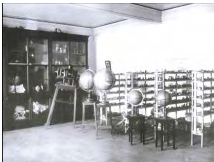
Ilustração - 2 – O Laboratório de Ciências da Escola Normal de São Carlos era constituído de diversos aparelhos importados da Europa e dos Estados Unidos da América.