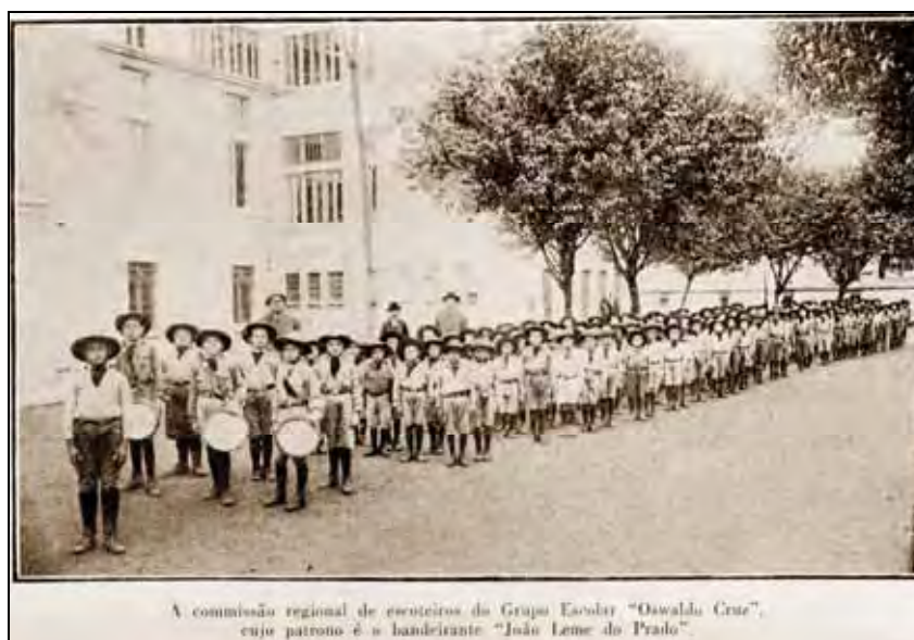
Ilustração 10 - A comissão regional de escoteiros do grupo escolar “Oswaldo Cruz”. Para os intelectuais das décadas de 1910 e 1920 o escotismo tinha um papel fundamental na formação da identidade nacional, pois dentre os valores apregoados eram priorizados a disciplina e o amor a pátria.

Como narrou José Ribeiro Escobar, em “Histórico da Instrução Pública Paulista” (1933, p.160), o escotismo atingiu o auge na presidência de Washington Luis: “havendo 500 comissões, com mais de 100.000 escoteiros, grandes concentrações no interior, um desfile de 7000 escoteiros na Capital, e obtendo o escotismo o grande prêmio na Exposição do Centenário da Independência”, realizada em 1922, na capital da República. Se por um lado, o escotismo era um grande aliado para a “moralização” e “segurança nacional”, por outro, o povo e a imigração despertavam calorosos debates em relação a estas questões.