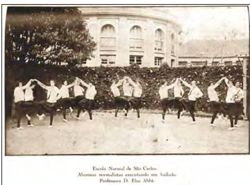
Ilustração 3 – As atividades físicas na Escola Normal de São Carlos eram consideradas de suma importância para o desenvolvimento do educando, a dança em especial, se destacava com arte que valorizava a elegância e disciplina dos alunos.

Sala de Educação Física – equipada com aparelhos de ginástica sueca, parede, quadros suspensos, barras paralelas, cavalos para saltos, cordas, bolas, bastões, equipamento para esgrima, equipamentos de esportes de campo e quadra de tênis, basquete, vôlei, cricket , salto em altura, pista de corrida. (Ilustração – 3).