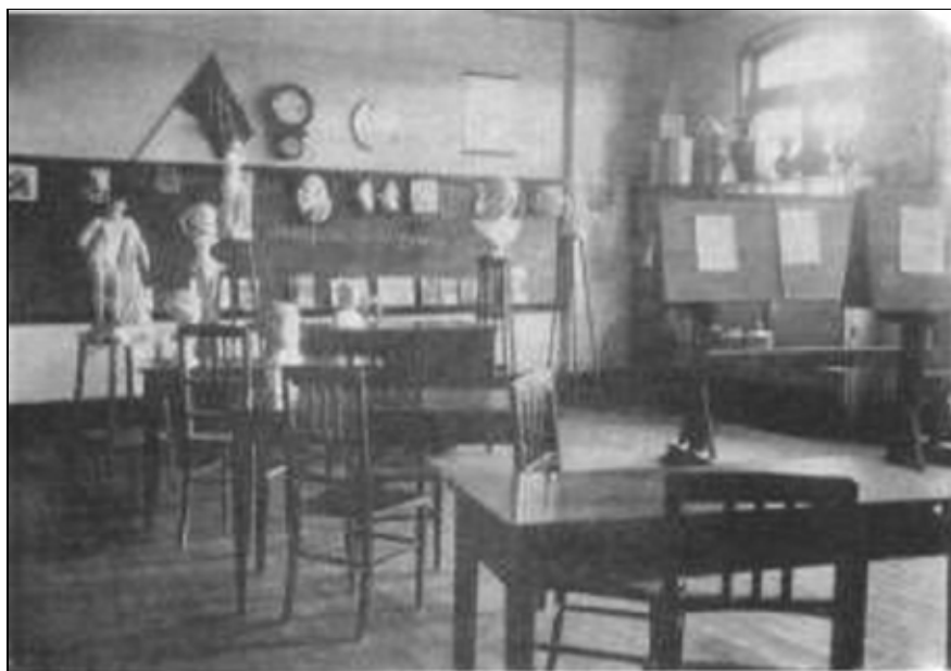
Ilustração - 4 – A Sala de Desenho da Escola Normal de São Carlos era composta por diversos materiais didático-pedagógicos pautados nos estudos mais modernos da época.

Sala de Desenho – equipada com coleções de sólidos geométricos, modelos e objetos para aulas de desenho ao natural e compassos, transferidores, pedestais, pranchetas e esquadros, entre outros. (Ilustração – 4)