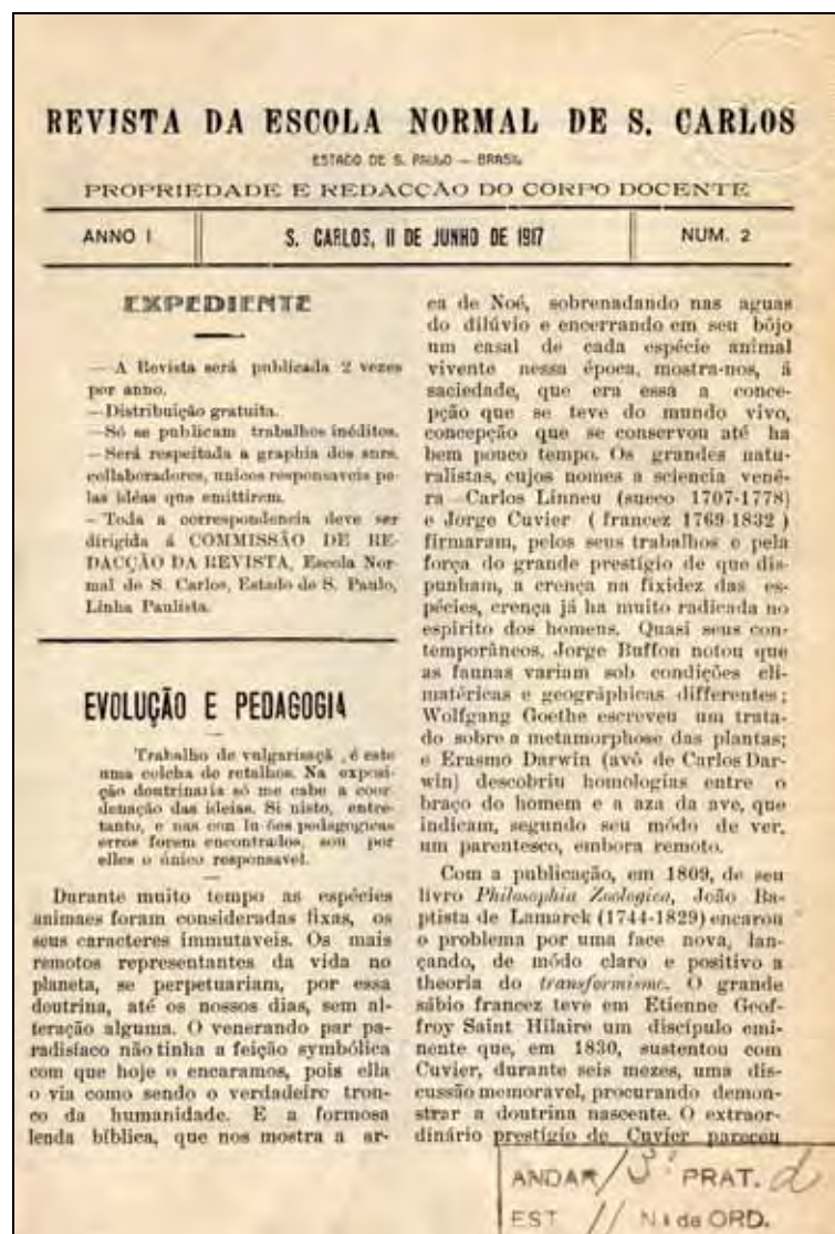
Ilustração 6 — Para os autores da Revista a educação não é um fato isolado puramente humano, mas sim um fenômeno integralizado com fatores biológicos e sociais.

Ferreira, Tipografia Joaquim Augusto, Estabelecimento Tipográfico Tancredo Camargo, e A Gráfica, de Marra e Filhos. As mudanças sucessivas de estabelecimentos foram significativas, porém não constam explicações a respeito.