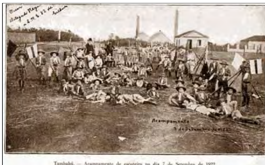
Ilustração 11 – Tambaú - acampamento de escoteiros no dia 7 de Setembro de 1922. Honra, lealdade, amizade, fraternidade, respeito com o meio ambiente, disciplina, auto-estima e caráter, princípios que faziam parte da vida de um escoteiro.