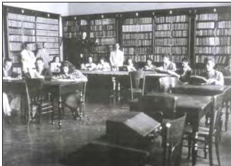
Ilustração - 1 – A Biblioteca da Escola Normal de São Carlos contava com um acervo riquíssimo com obras raras, algumas datadas do final século XVI.

auditiva, gustativa e tátil; e o Gabinete de Geografia com coleções de mapas, globos terrestres, atlas, bússolas, barômetros, termômetros. (Ilustração – 2).