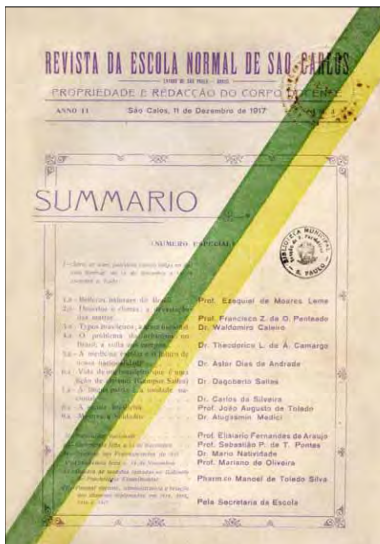
Ilustração 8 – O nacionalismo foi destaque na edição especial da Revista que teve sua capa adornada por listras verde e amarela.

fascículo do fascículo, local de edição, data de publicação. De feição temática, o fascículo 3, é adornado por listras diagonais nas cores verde e amarelo, reforçando com esse recurso gráfico o caráter e o conteúdo cívico-patriótico (Ilustração 8). Já a capa do fascículo 1 exibe uma figura feminina envolta em ramos de café, simbolizando a imagem da República (Ilustração 9).