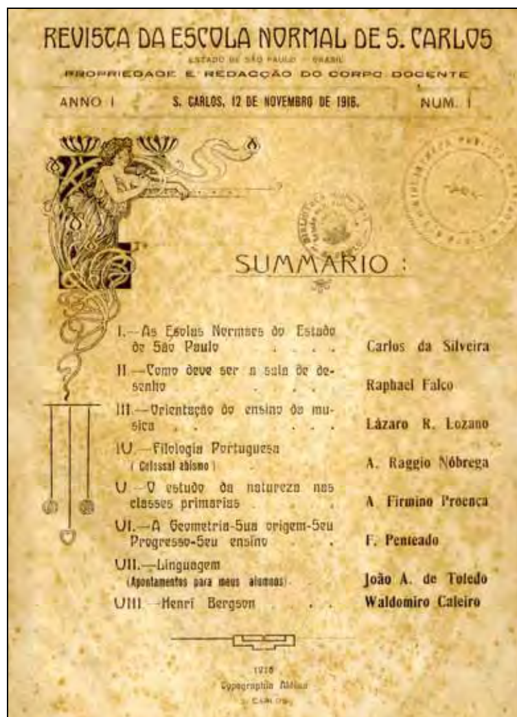
Ilustração 9 – A “República Mulher” mãe dos cidadãos, defensora dos valores de liberdade, igualdade e fraternidade foi destaque na capa do primeiro número da Revista .