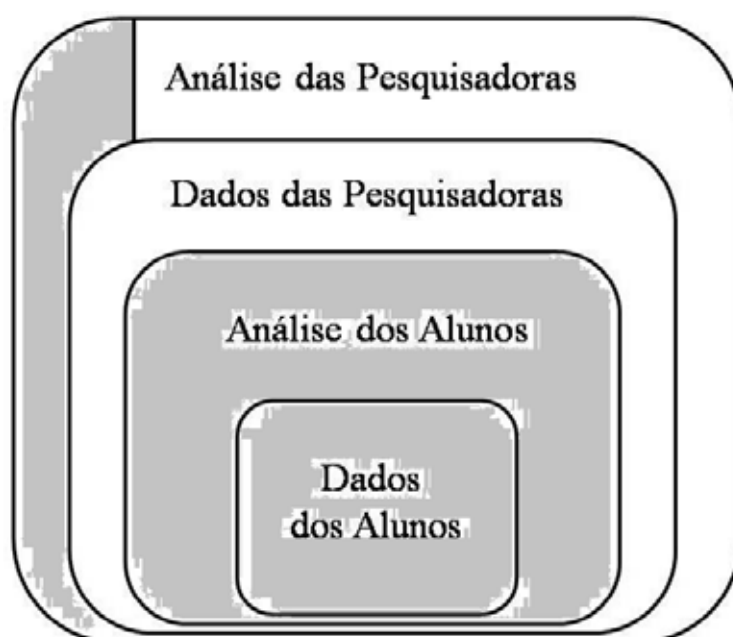
Figura 1: A parte cinza ilustra o que será tratado no capítulo 6 e a parte branca, no capítulo 7.