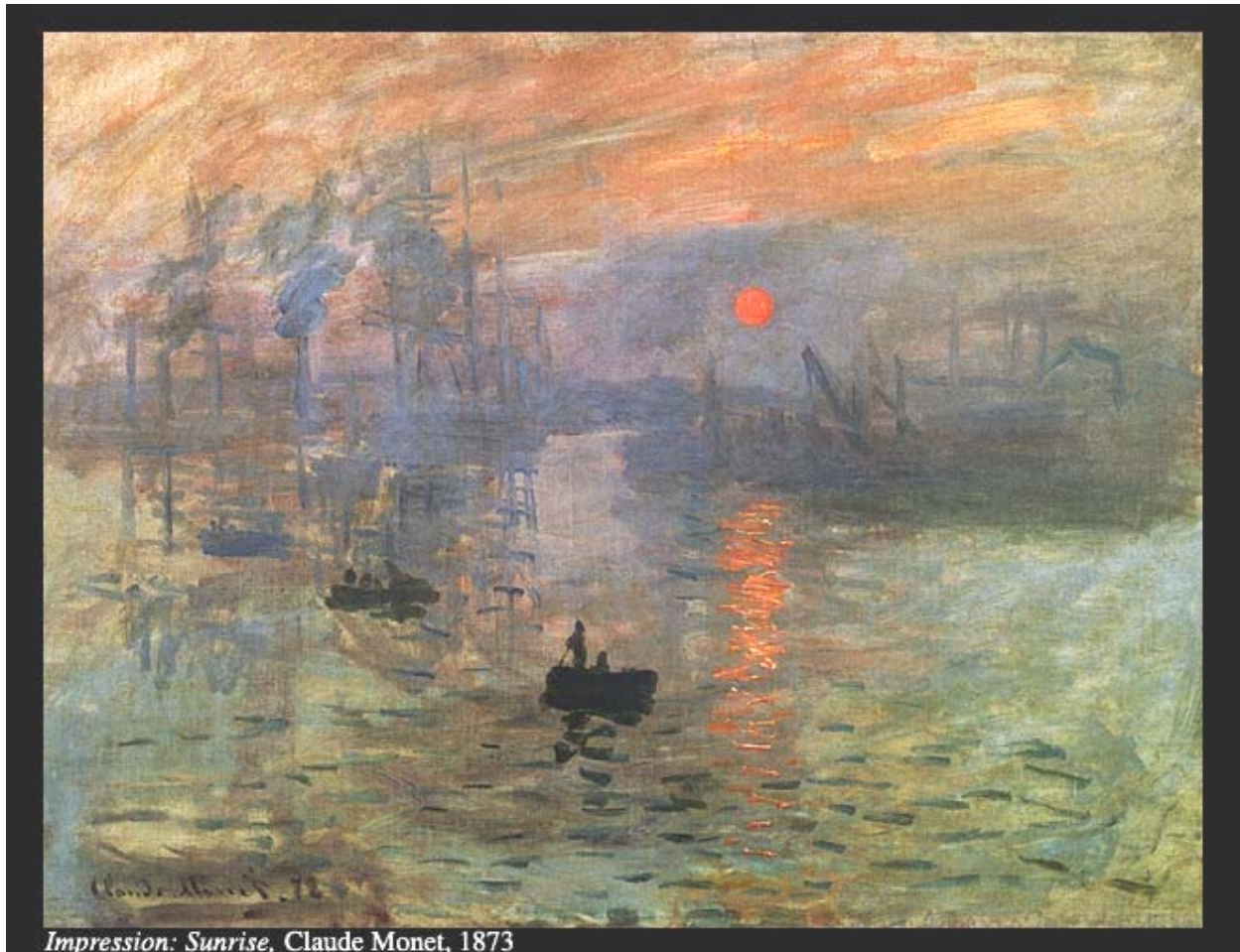
Impression: Sunrise, Claude Monet, 1873