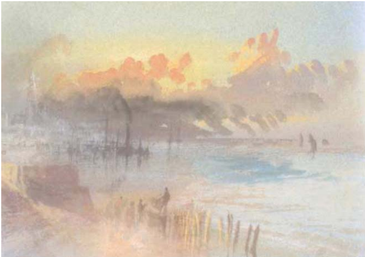
O Porto de Margate ao nascer do sol, c. 1835-1840