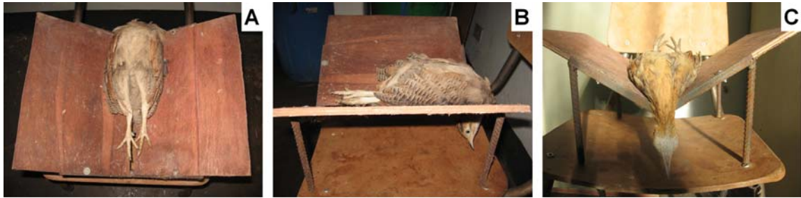
Figura 2 – Ave em imobilidade tônica, visualizada por diferentes ângulos. (A) vista geral; (B) vista lateral; (C) vista frontal