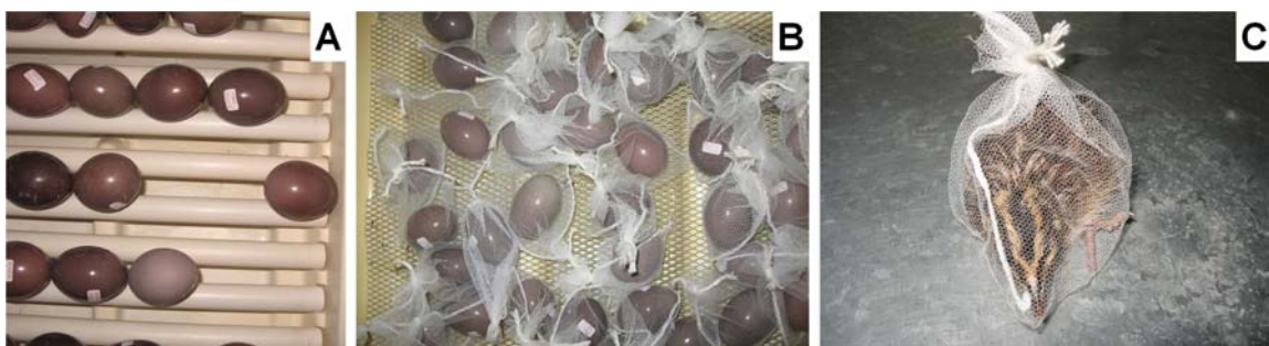
Figura 1. Ilustração do manejo dos ovos de perdiz ( Rhynchotus rufescens ) e perdigoto. (A) ovos na incubadora com giro automático; (B) Ovos no saco de filó para identificação da genealogia; (C) Nascimento do perdigoto

A eclosão ocorreu por volta de 21 dias após a postura (Figura 1C). Após o nascimento, os perdigotos eram pesados e recebiam anilhas provisórias constituídas por abraçadeiras coloridas na pata, cuja combinação de cores correspondia ao número do ovo e à linhagem a que pertenciam. Os perdigotos eram abrigados em criadeiras, também instaladas no Departamento de Morfologia e Fisiologia Animal, possuindo em seu interior lâmpadas para aquecer os filhotes e bandejas removíveis coletoras de dejetos, possibilitando melhor limpeza que era realizada diariamente pelo tratador. Os perdigotos receberam ração farelada contendo em sua formulação 28% de Proteína Bruta e 2800 kcal/EM/kg e água com 1 gota de Vita Gold, ad libitum e após 5 a 10 dias alojados nestas criadeiras, eram pesados e transferidos ao galpão de recria do Setor de Animais Silvestres da FCAV/UNESP.