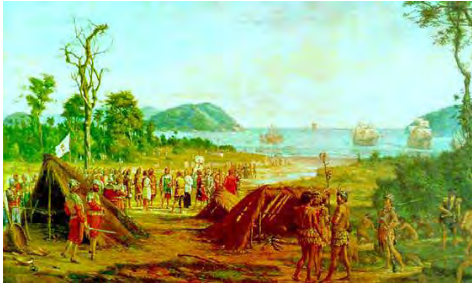
Figura 2 - A fundação de São Vicente – Benedito Calixto. Acervo do Museu Paulista

da visão de Calixto em relação ao tema de sua obra na época em que foi produzida, ou seja, é uma reconstrução do imaginário da época.