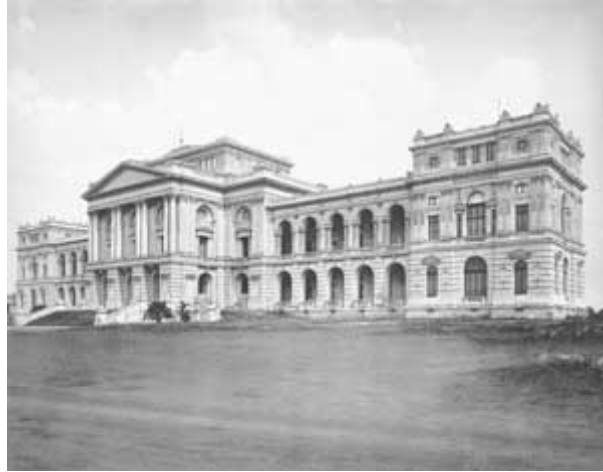
Figura 4 - Museu Paulista em 1902. Acervo do Museu Paulista Fonte: www.aprenda450anos.com.br/450anos/vila_metrop...

Segundo Witter (1999), o acervo do Museu Paulista teve sua origem na coleção do Coronel Joaquim Sertório, que incluía peças de espécimes de História Natural e peças de interesse etnográfico e histórico. Essa coleção foi adquirida pelo Conselheiro Francisco de Paula Mayrink, que juntamente com objetos da coleção Pessanha foi posteriormente doada para o Governo do Estado.