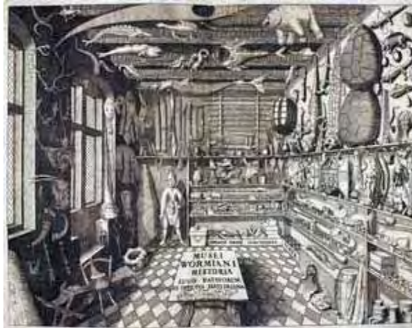
Figura 1 - Frontispício do Musei Wormiani Historia mostrando o quarto das maravilhas de Worm

No século XVIII, encontramos dois tipos de museus: os didáticos, ilustrados ou “museus da razão” e os patrimoniais, preservacionistas ou “museus da culpa”. A acumulação de obras de arte era símbolo de riqueza e saber: nessa época fundaram-se importantes museus de arte e história natural. A ordenação sistemática é requisito para a publicação dos catálogos, as grandes coleções foram reorganizadas e separadas por seções segundo suas especialidades, criaram-se galerias 6 de arte, escolas de desenho e academias. Surgem as exposições temporárias e a noção de arte acessível a todo tipo de público. Quanto à documentação das coleções, novos princípios de disposição foram criados nas galerias de arte, houve a popularização dos inventários e guias, surgem os primeiros métodos de documentação manual para fichas, sistematização, identificação e guias. Foi produzida uma variedade de inventários e catálogos ilustrados, no caso das pinacotecas as ilustrações são acompanhadas por um texto indicando a localização, o autor e as dimensões do quadro. Neste sentido, Torres (2002, p. 137, tradução nossa) sintetiza as grandes mudanças ocorridas: