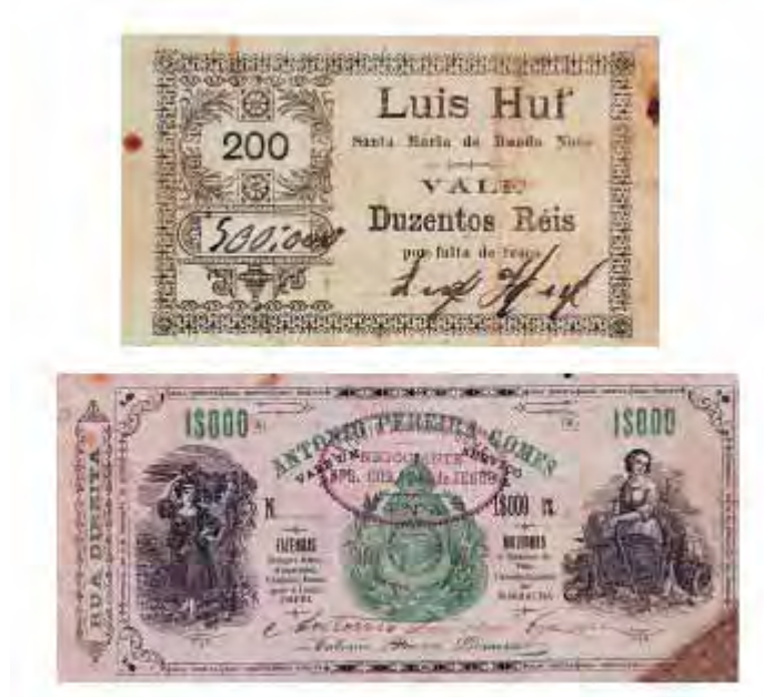
Figura 8 - Vales. Acervo do Museu Paulista Fonte: www2.uol.com.br/historiaviva/noticias/museu_d...

A sublinha 3 – Cultura visual no século XIX: museus, exposições industriais e cidades , avalia os seguintes aspectos: