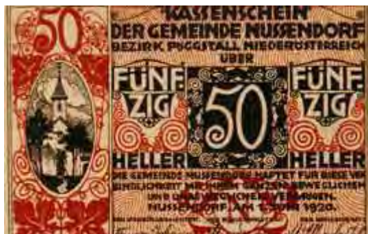
Figura 7- Dinheiro de emergência.

Na sublinha 2 – Formas alternativas de dinheiro , a situação política e econômica, a organização da sociedade, os atributos de valores em diferentes períodos, são alguns aspectos que podem ser verificados por meio das formas alternativas de dinheiro. Neste grupo encontram-se os vales, os bilhetes de trens e bondes, as fichas de controle de entrada e saída, os carimbos, ilustrados nas figuras 7 e 8.