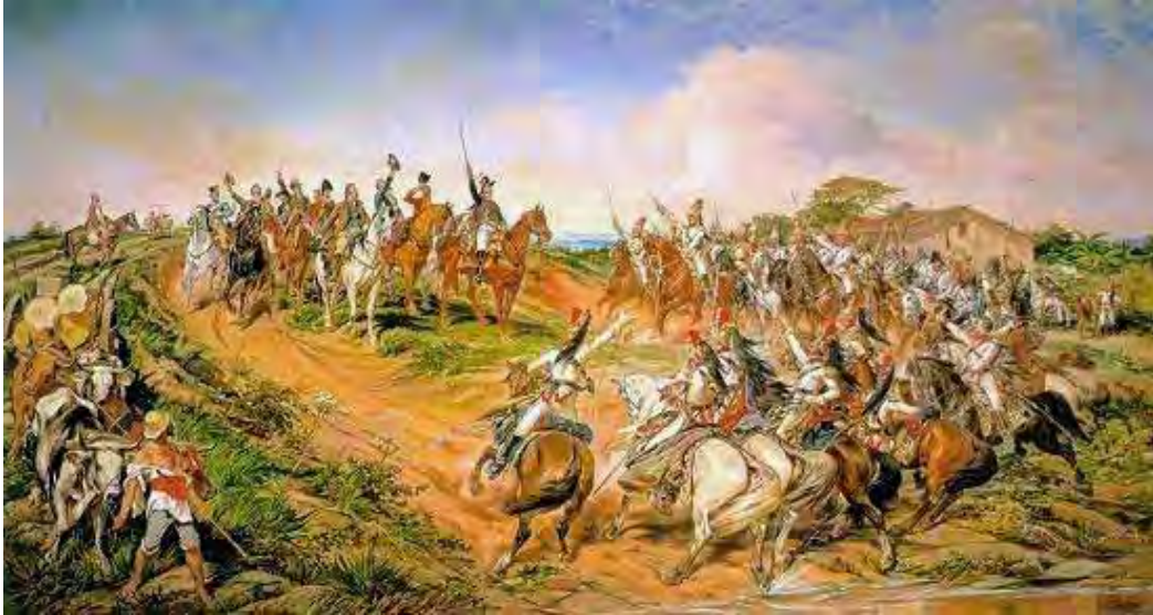
Figura 5 - Independência ou morte, 1888.

Na figura 5, podemos ver a famosa tela de Pedro Américo, Independência ou morte.