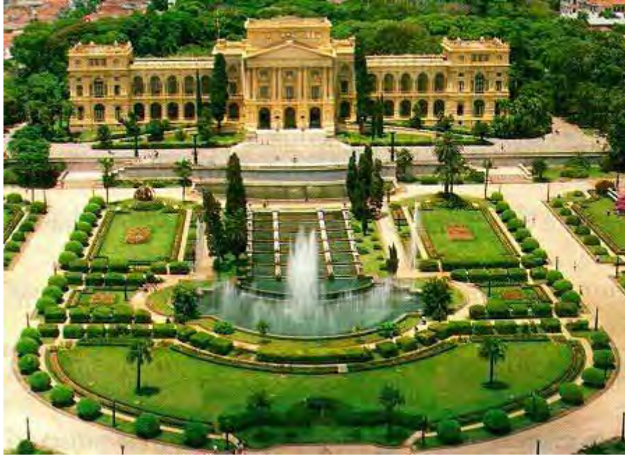
Figura 6 - O Museu Paulista e seu jardim

O Museu Paulista, no âmbito da gestão e organização de seu acervo, criou três departamentos responsáveis pela curadoria de cada tipo de coleção, o Serviço de Objetos, o Serviço de Iconografia e o Serviço de Arquivística. Estaremos nos restringindo ao trabalho realizado pelo Serviço de Objetos, responsável pela curadoria do acervo de tridimensionais.