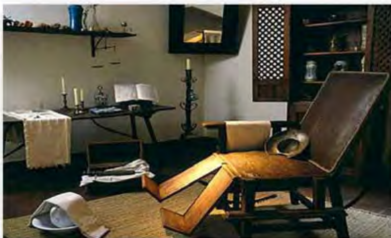
Consultório do sangrador Rodrigo Cervantes, pai de Miguel de Cervantes, em Alcalá de Henares

Apenas por curiosidade, o pai de Miguel de Cervantes, o célebre autor do Dom Quixote , tinha a profissão de sangrador, na cidade de Alcalá de Henares, Espanha, onde nasceu Cervantes, e exercia a profissão na sua própria casa, em um cômodo preparado para isso, como se pode ver na ilustração a seguir: