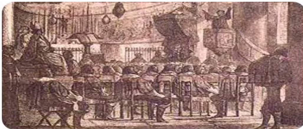
Padre Vieira pregando

máxima do Barroco em prosa sacra e um dos principais meios de difusão da ideologia e da literatura da Contrarreforma.