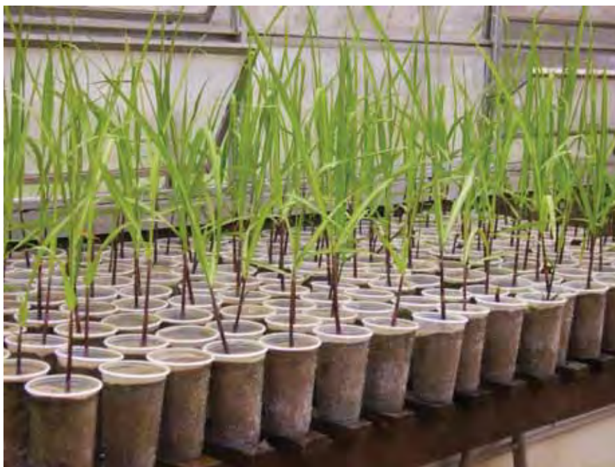
Figura 1. Mudanças de cana de açúcar preparadas a partir de minitoletes plantados em recipientes de 500 m 3 contendo areia lavada.

As mudas de cana de açúcar (RB 86 7515) foram preparadas em recipientes com 500 cm 3 de areia, a partir de minitoletes com 5 cm de comprimento e contendo 1 gema (Figura 1), sendo conduzida por um período de aproximadamente 40 dias.