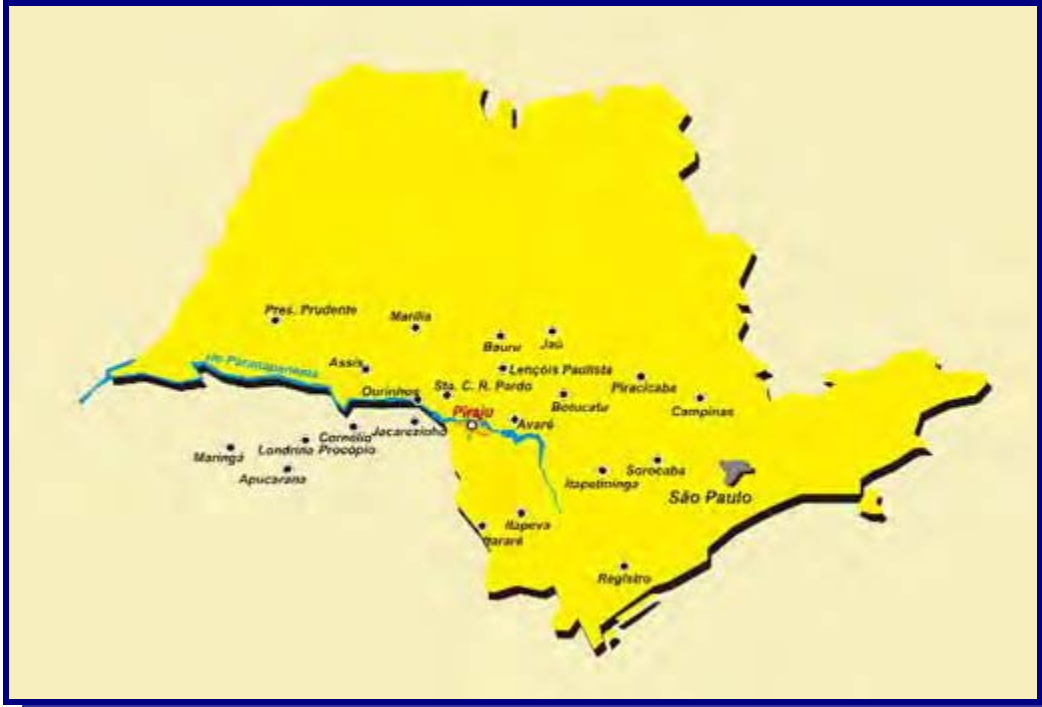
Figura 1 - Localização do município de Piraju, no Estado de São Paulo.

A pesquisa foi realizada no município de Piraju, Estado de São Paulo, situado no Km 331 da Rodovia Raposo Tavares, região Sudoeste do Estado, tendo como principais vias de acesso, a própria Rodovia Raposo Tavares e a Rodovia Castelo Branco. Piraju dista-se a 335 km da Capital do Estado.