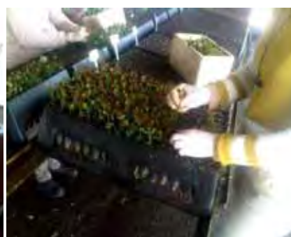
Estaquia das mudas