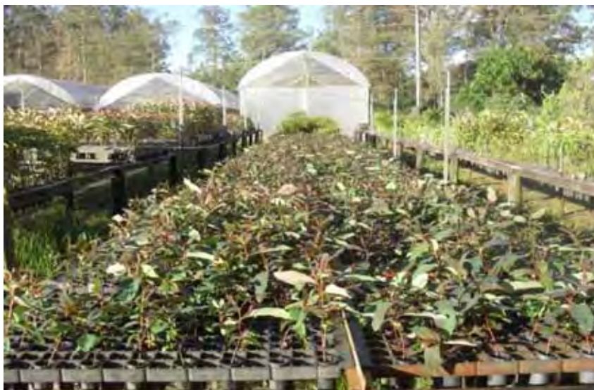
Área a pleno sol