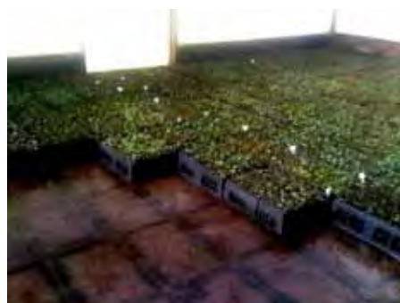
Casa de vegetação