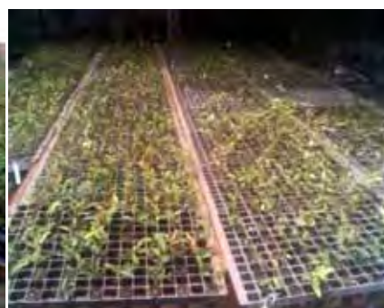
Casa de sombra