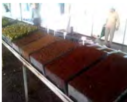
Bandejas e tubetes preenchidos