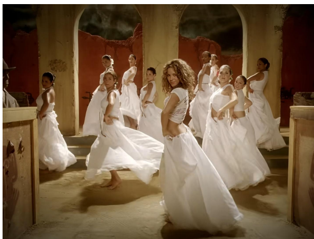
Figura 7: As mulheres no clipe de Shakira