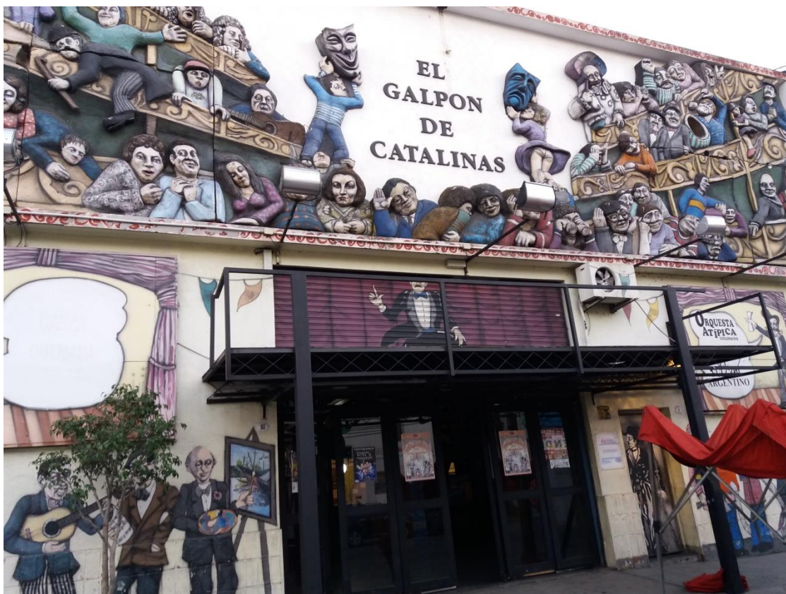
Figura 2 – Galpão do Catalinas