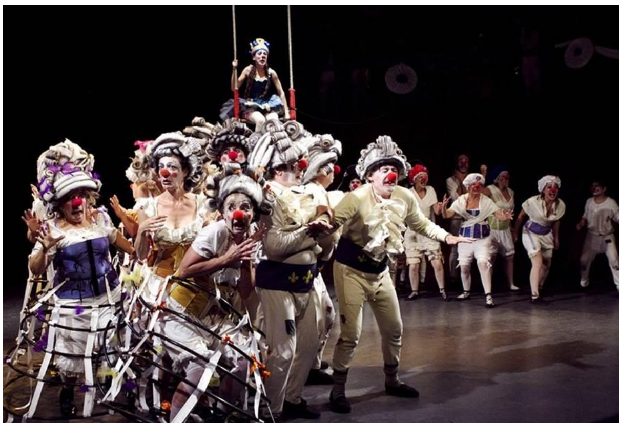
Figura 3 - Espetáculo Carpa Quemada. “El circo del centenario”.