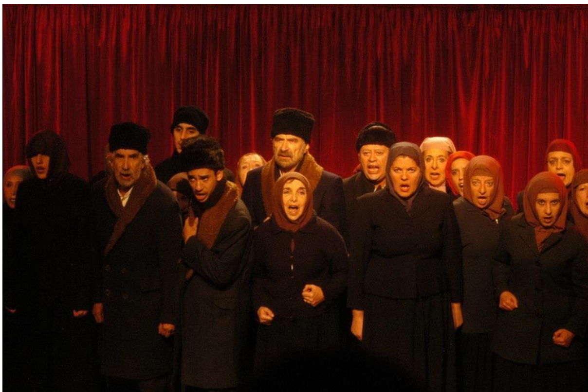
Figura 4 – Espetáculo La Caravana