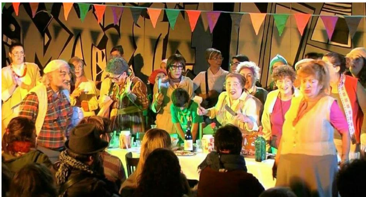
Figura 5 – Espetáculo Herido Barrio