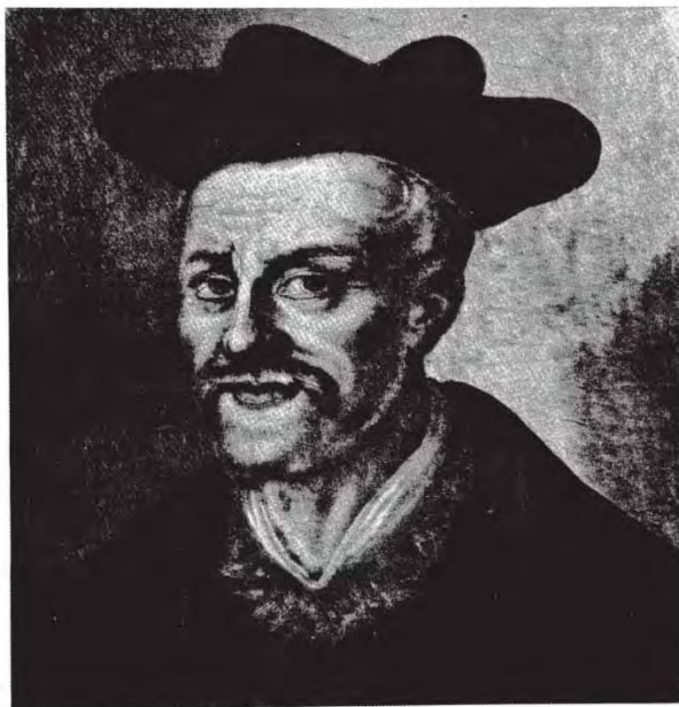
Figura 1: François Rabelais - Pintura anônima do séc. XVII 21