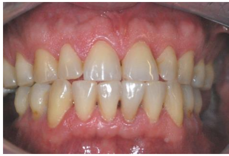
Figura 1. Início do tratamento. Vista frontal e lateral.