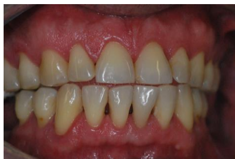
Figura 3. Após 90 dias do início do tratamento. Vista frontal e lateral.