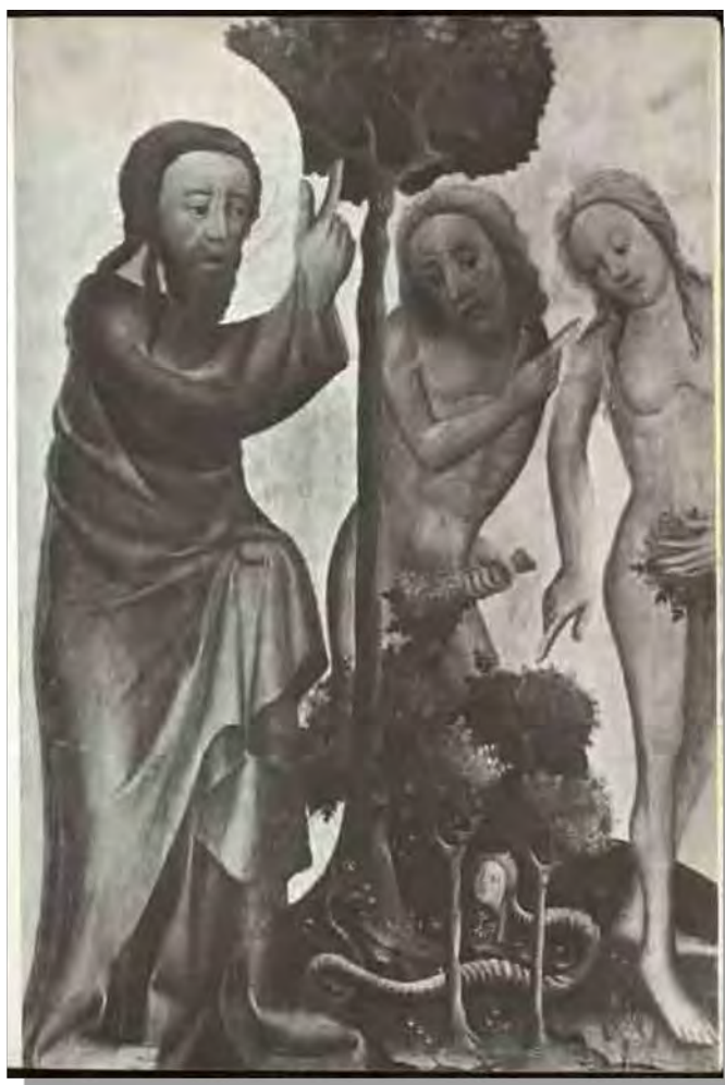
Figura 1: Castigo de Adão - Mestre Bertram de Mindem 2

Observando a imagem acima, podemos tecer algumas considerações que nos levam a compreender certas linhas sutis sobre a abordagem da natureza no período da Idade Média que, numa tomada ampla, também regulará a noção geral do tempo. Segundo Bauab (2005), o quadro representa a concepção divina instaurada pela Igreja cristã no que corresponde a dependência do homem após a queda do paraíso. Deus, devido ao pecado dos homens, aponta para Adão, impondo-lhe a culpa, este a