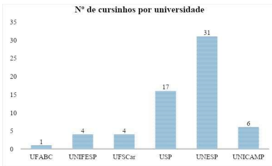
Gráfico 1. Número de cursinhos por universidade.