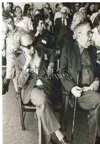
Instalação do Centro Brasil Democrático, vendo-se em 1ºplano da esquerda para direita: Oscar Niemeyer e Sérgio Buarque de Holanda, entre outros.