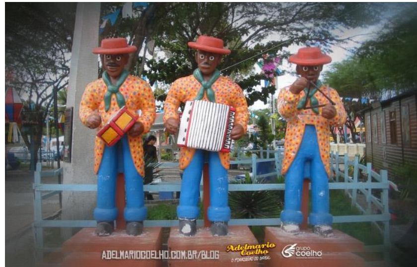
Figura 6 - Estatuas representando um trio de Forró