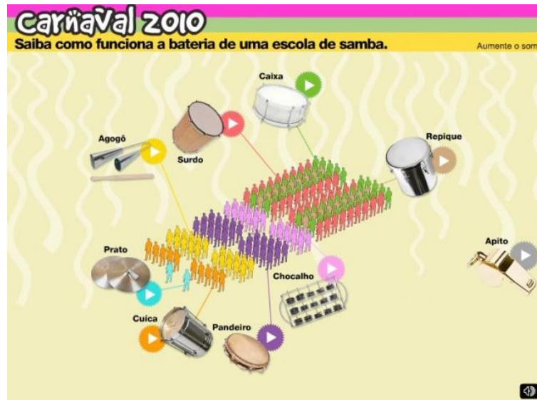
Figura 5 - Bateria de Escola de Samba