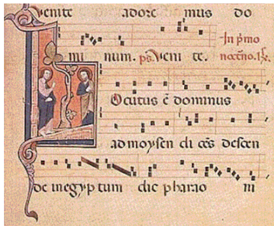
Figura 1 - Neuma do Século XII

Os neumas procuravam imitar por dentro o movimento da forma vocal na sua gênese, com sua complexidade latente, seu tempo próprio, sua continuidade necessária. (Dufourt, 2014, p.11)