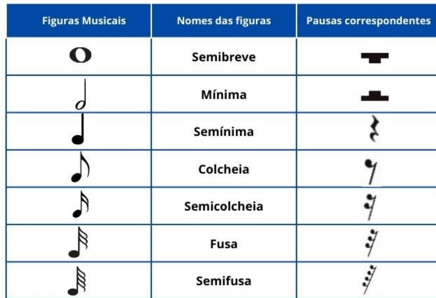
Quadro 2 - Figuras Musicais