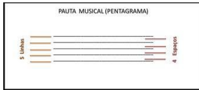
Figura 2 - Pentagrama Musical

símbolos taquigráficos gregos - notação fonética. Do século V ao século VII foi aperfeiçoado um sistema de neumas, uma espécie mnemônica, que não define altura exata, apenas dava uma ideia aproximada da melodia. Por volta do século IX surge a pauta. [...] Guido d'Arezzo (992-1050) sugeriu o emprego de três e quatro linhas [...] O pentagrama, sistema de cinco linhas paralelas, conhecido desde o século XI, foi adotado apenas no início do século XVII.