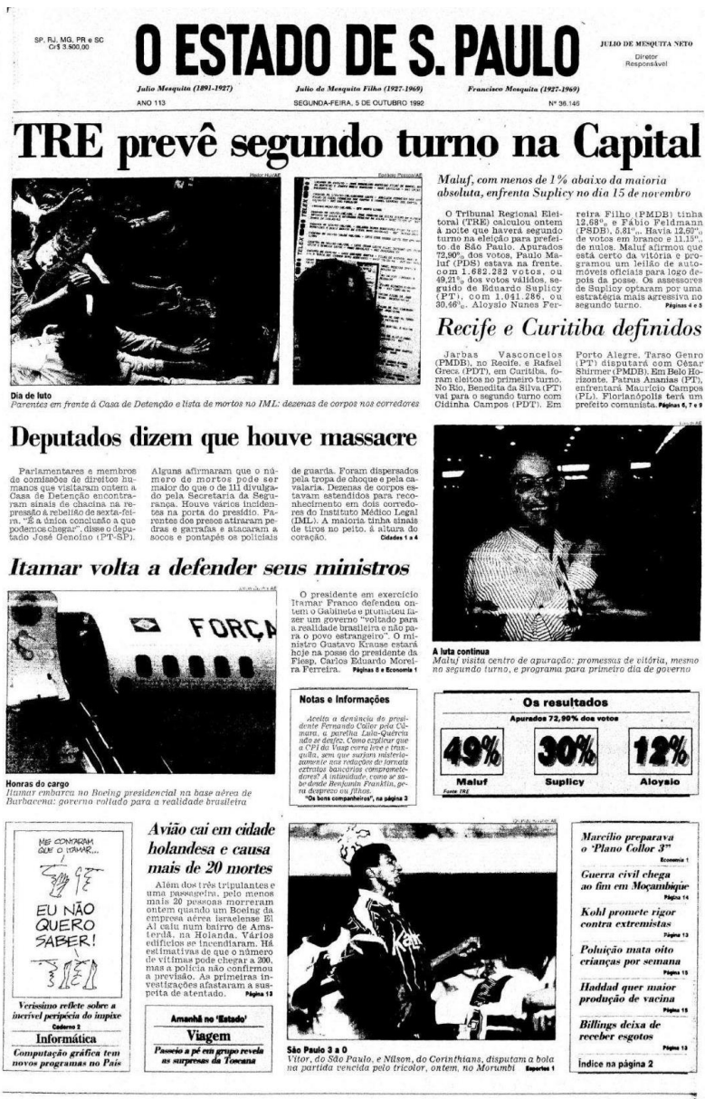
Figura 8 - Capa da edição de 05 de outubro de 1992 do jornal O Estado de S. Paulo