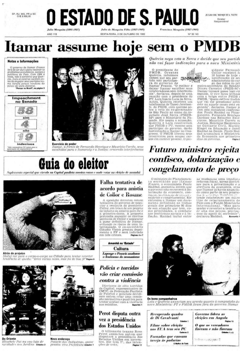
Figura 2 - Capa da edição de 02 de outubro de 1992 do jornal O Estado de S. Paulo

As páginas dos jornais em 1992 eram marcadas pela instabilidade política que o Brasil enfrentava. Fernando Collor de Mello, então presidente, estava no centro das atenções públicas devido a denúncias de corrupção e à crise econômica que assolava o país. Durante o mês em que se desenrolou o processo de impeachment de Collor, a semana do dia 2 de outubro foi a mais movimentada, com a instauração do processo no Senado, que culminou no afastamento do presidente e na posse do então vice-presidente, Itamar Franco.