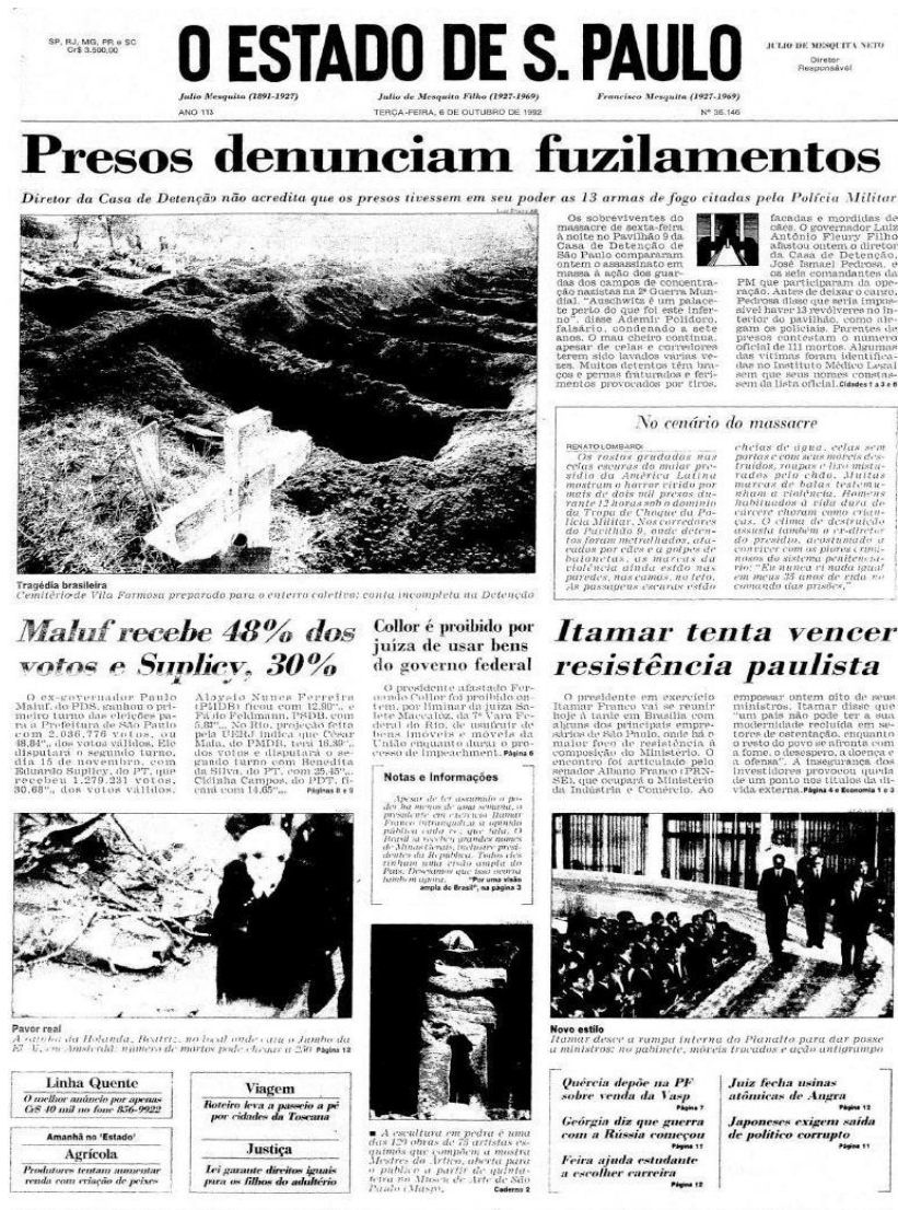
Figura 14 - Capa da edição de 6 de outubro de 1992 do jornal O Estado de S. Paulo

Desse modo, ao articular o olhar internacional, os embates políticos e o drama vivido pelos afetados pelo Massacre, O Estado de S. Paulo constrói uma narrativa que se distancia dos padrões de ocultação levantados por Abramo (2003, p.24), pois, segundo o autor, “a manipulação das informações se transforma, assim, em manipulação da realidade” e envolve considerações como “o que merece ser conhecido pelo público e o que merece ser ocultado”. Com base nessas considerações, percebe-se que o jornal se posiciona como um agente de mediação entre os fatos para a construção da opinião pública sobre o caso, contribuindo para que o Massacre do Carandiru seja lembrado como um episódio simbólico da falha estatal e do sistema penitenciário brasileiro.