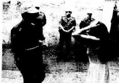
Pranto Com o reconhecimento das corpos no necrotério do IML, a choro era constante