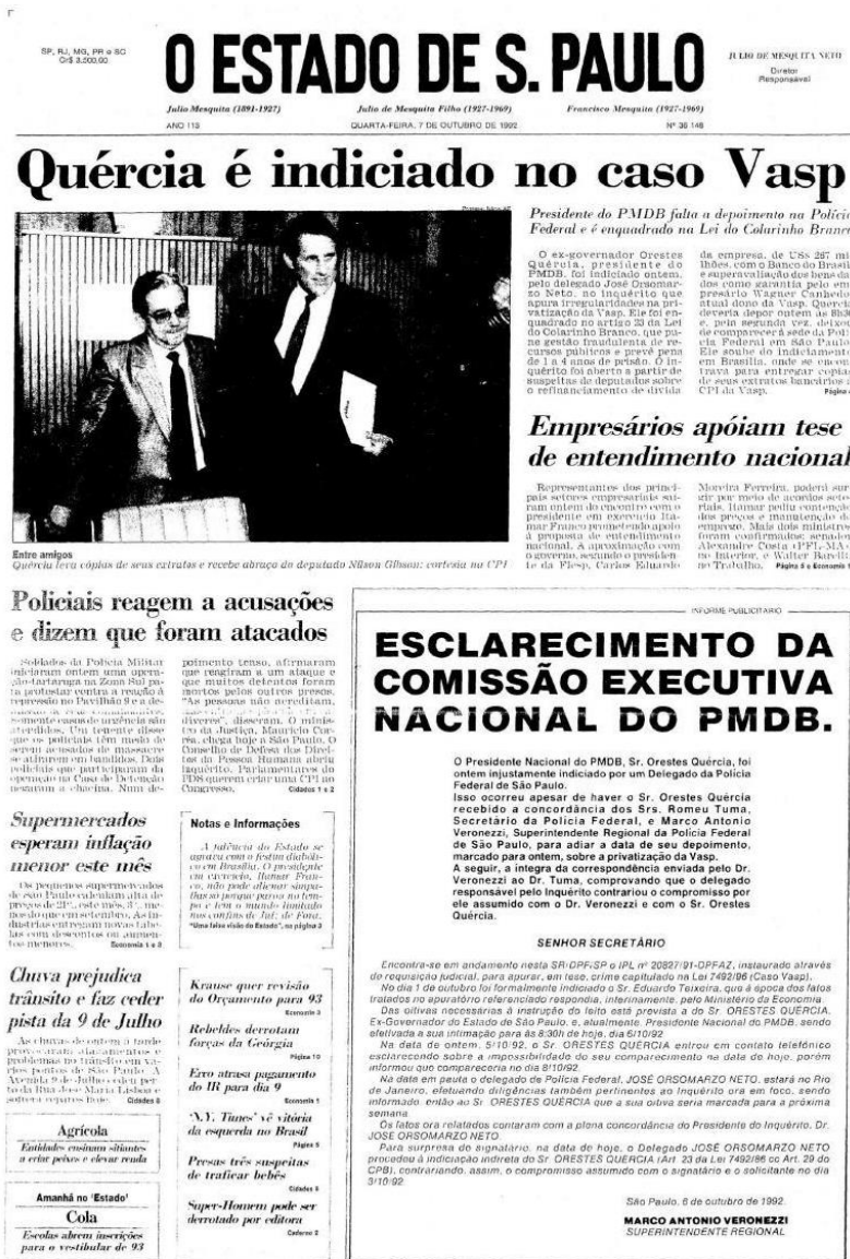
Figura 19 - Capa da edição de 7 de outubro de 1992 do jornal O Estado de S. Paulo

Esse olhar externo e sem influência pelas dinâmicas das políticas locais, contribuiu para pressionar as autoridades brasileiras por respostas mais contundentes e transparentes. Além disso, também reforçou a percepção de que o Massacre não era apenas um problema interno, mas um sintoma de violações sistemáticas de direitos humanos no sistema prisional brasileiro, consolidando o fato como um símbolo internacional da violência estatal e do fracasso institucional.