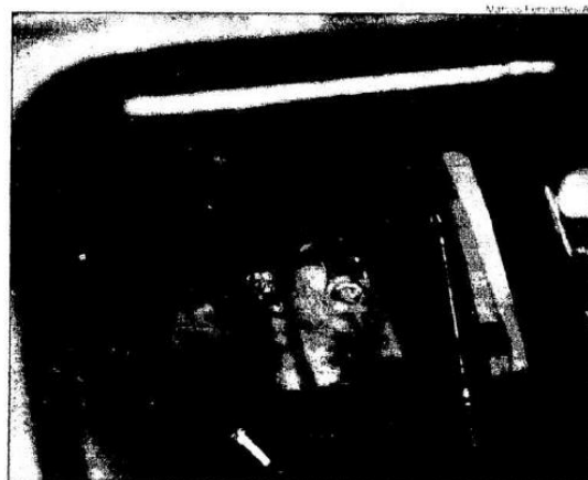
Guerra no presídio Policial ferido é socorrido na rebelião na Casa de Detenção de São Paulo: briga pela disputa de poder entre quadrilhas de traficantes