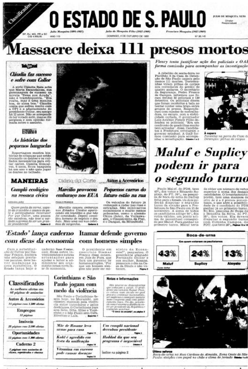
Figura 6 - Capa da edição de 04 de outubro de 1992 do jornal O Estado de S. Paulo