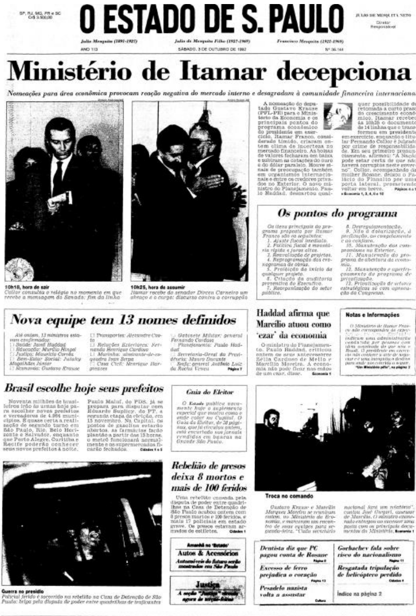
Figura 3 - Capa da edição de 03 de outubro de 1992 do jornal O Estado de S.Paulo