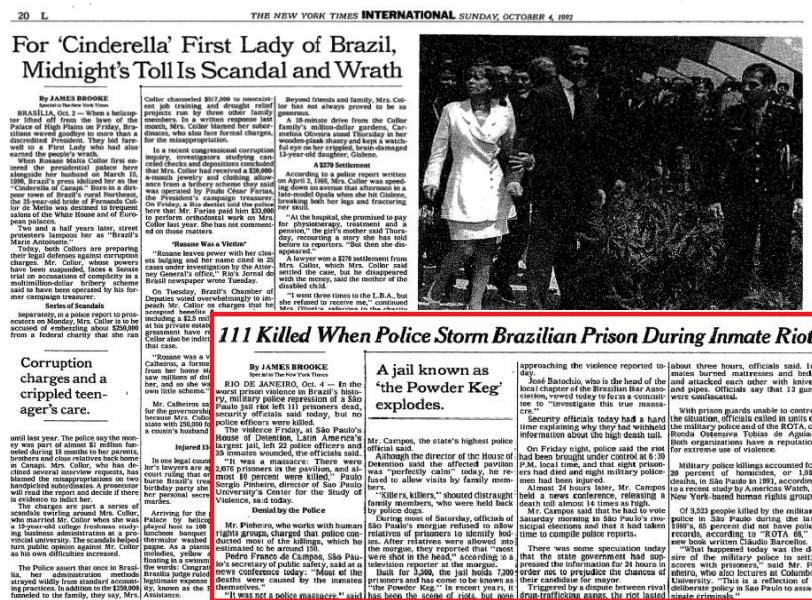
Figura 1 - Editoria “internacional” da edição de 4 de outubro de 1992 do jornal The New York Times

A matéria dividiu espaço com outro escândalo político: as acusações de corrupção envolvendo Rosane Malta Collor, então primeira-dama e esposa do ex-presidente Fernando Collor de Mello.