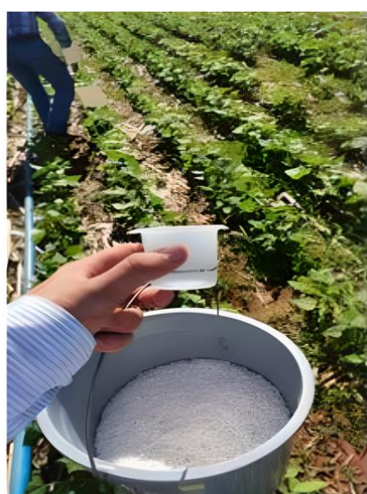
Apêndice 6: Adubação de cobertura utilizando Ureia (45% de Nitrogênio).