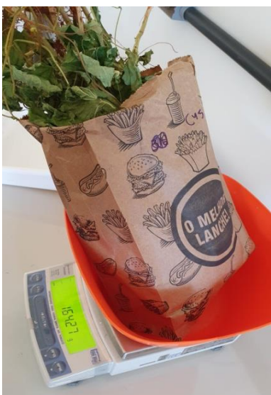
Apêndice 11: Pesagem das amostras para determinação de massa seca.