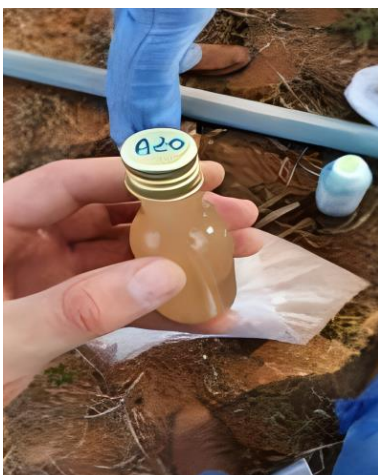
Apêndice 4: Inoculante líquido Azospirillum brasilense estirpes Ab-V5 e Ab-V6.