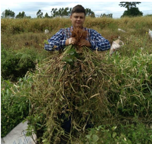
Apêndice 9: Colheita do feijoeiro e avaliação da população de plantas.