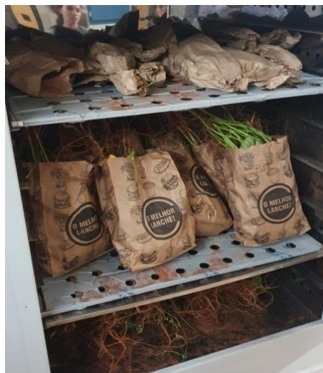
Apêndice 10: Plantas de feijoeiro na estufa a 65 °C.