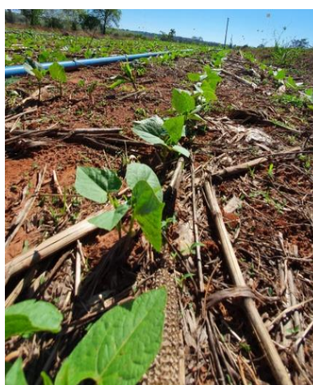
Apêndice 8: Feijoeiro em seus primeiros dias após emergência (12 DAE).