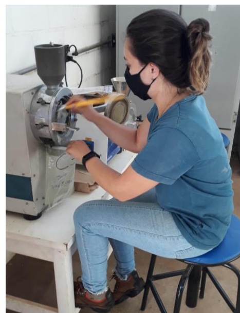
Apêndice 12: Moagem das amostras secas de feijoeiro.