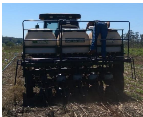
Apêndice 5: semeadora adubadora utilizada para a semeadura do feijão.