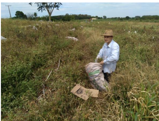
Apêndice 13: Coleta de 10 plantas nas linhas uteis para avaliação de componentes de produção.