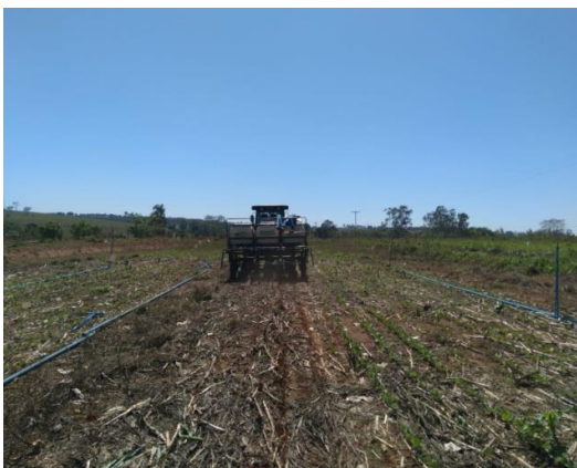
Apêndice 2: Semeadura do feijão sob a palhada do milho.