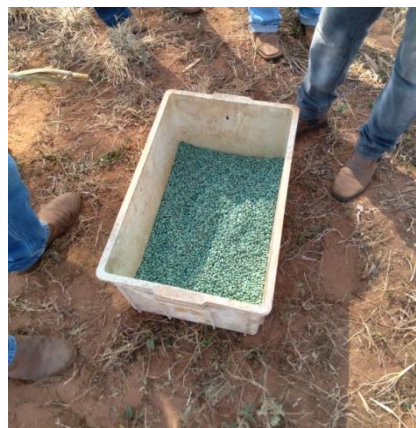
Apêndice 3: Tratamento de sementes com fungicida e inseticida.