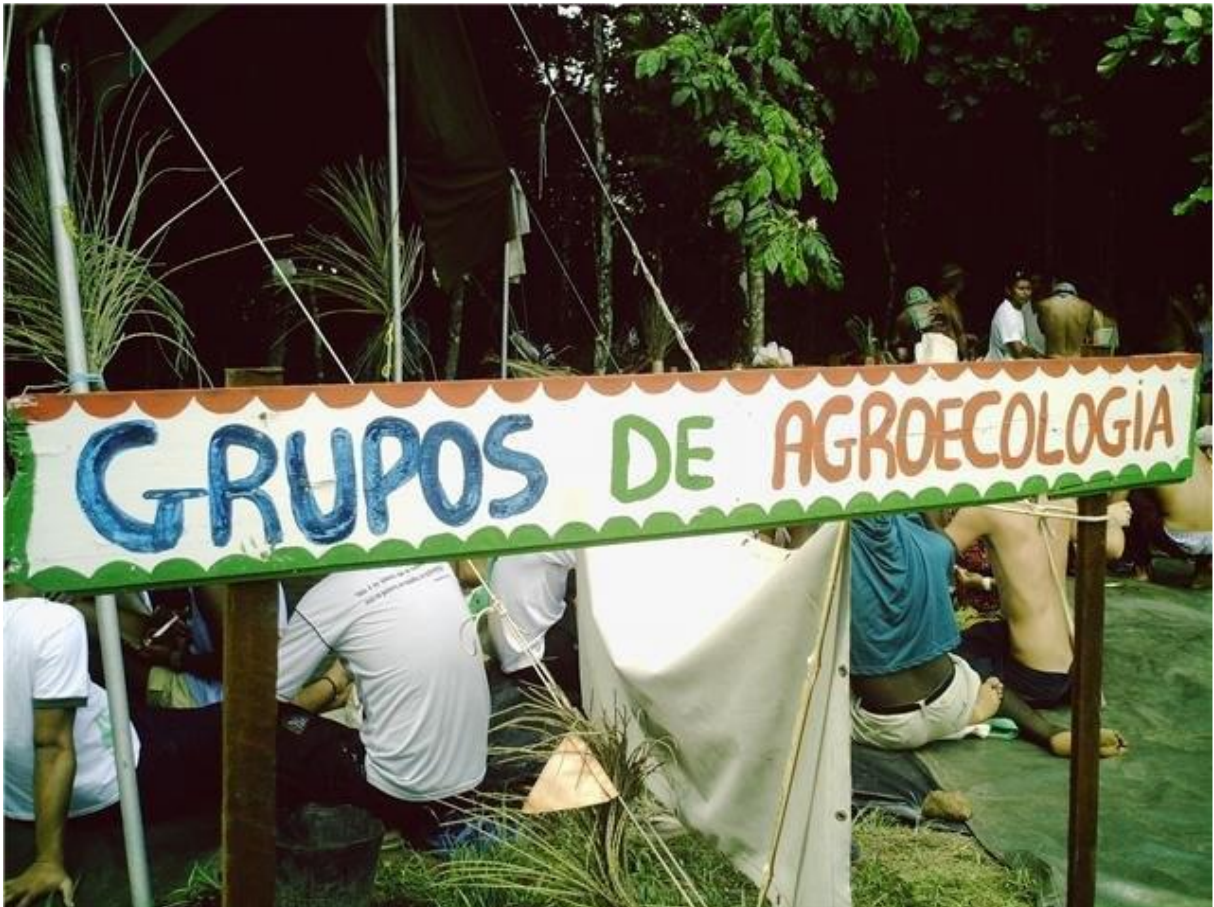
Figura 1: Reunião dos coletivos durante o Fórum Social Mundial em 2009, em Belém – PA, na área do grupo IARA – UFRA.

Em novembro de 2009 em Curitiba, paralelamente ao VI Congresso Brasileiro de Agroecologia (CBA) e II Congresso Latino Americano de Agroecologia (CLAA) aconteceu o I Encontro de Grupos de Agroecologia, reunindo cerca de 500 pessoas entre FEAB, Via Campesina e grupos de agroecologia de todo o Brasil. Esse momento foi histórico para a juventude do movimento agroecológico, que não tinha um espaço plural, diverso e de formação para se encontrar e se reconhecer. Apesar da riqueza do encontro, um problema central já se mostrava aos organizadores: à maturidade de um primeiro espaço desse caráter, os grupos se apropriaram pouco dessa ferramenta, levando algumas vezes a esvaziamentos de espaços como plenárias e assembleias.