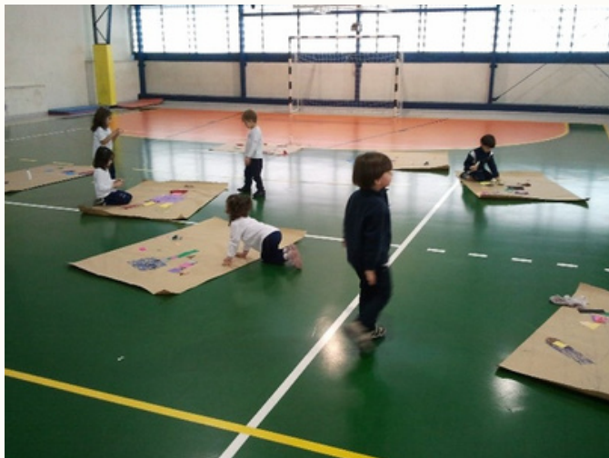
Preenchimento do corpo