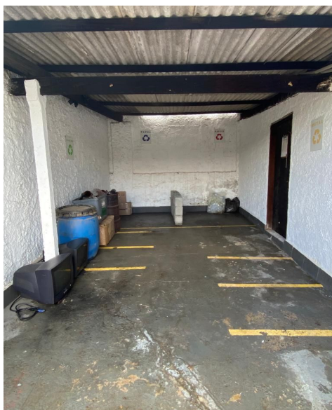
Figura 5: Local destinado para armazenamento dos resíduos

Dentro da empresa há uma área destinada apenas para resíduos não perigosos (Figura 5), a qual é subdividida em espaços demarcados, onde são armazenadas separadamente, e esperam pela coleta da transportadora/empresa responsável pelo tratamento final.