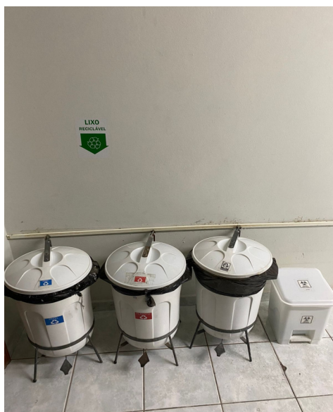
Figura 4: Coletores identificados com nomes de acordo com os padrões de coleta seletiva dentro do laboratório

Todas as áreas, incluindo os laboratórios, contam com coletores identificados com nomes de acordo com os padrões de coleta seletiva do Brasil, incluindo o de resíduo infectante, como é visto na figura 4.