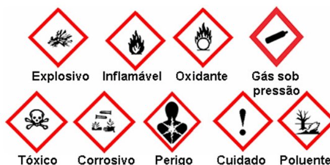
Figura 1: Pictogramas de Perigo

O item três da norma referente ao processo de rotulagem, determina um sistema simples de identificação, no qual o entendimento e aplicação funcionem de maneira imediata nos diferentes locais onde os produtos químicos perigosos são utilizados. O rótulo de um produto químico considerado perigoso deve conter obrigatoriamente as seguintes informações: identificação do produto e telefone de emergência do fornecedor, composição química, pictograma(s) de perigo (Figura 1), palavra de advertência, frase(s) de perigo, frase(s) de precaução, outras informações. (ABNT, 2012)