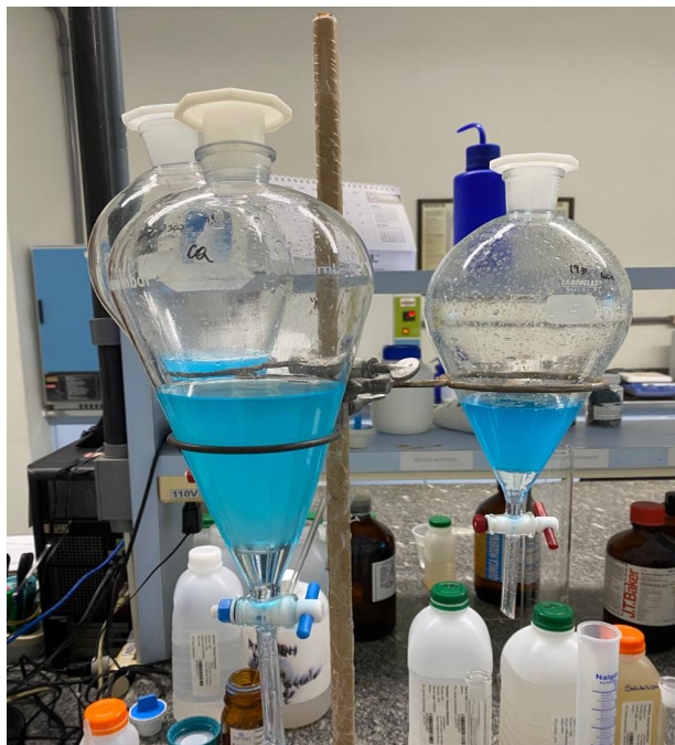
Figura 2: Funis de separação durante o ensaio de Surfactantes aniônicos em água - método azul de metileno

por lã de vidro, umedecida com clorofórmio e em seguida aferindo o volume de 100 mL restante com clorofórmio. As amostras devem ser lidas, juntamente com padrões em um espectrofotômetro, UV/visível a 652 nm, e o zero de absorvância utiliza-se o próprio clorofórmio. A Figura 2 apresenta uma fotografia de funis de separação durante o ensaio de Surfactantes.