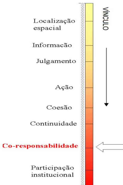
Figura 3: Escala de níveis de vinculação

chega a ser o ideal de projetos deste tipo. Logo, ações com este potencial equivalem ao estabelecimento de vínculos fortes, o que promove um caminho viável para geração da participação e efetivo êxito das iniciativas.