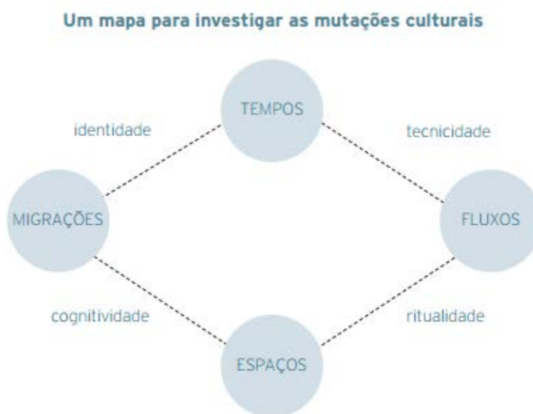
Figura 2: Um mapa para investigar as mutações culturais

tem sua compreensão a partir da instabilidade, e também a compressão do espaço e aí que o autor recompõe as duas mediações fundamentais anteriormente: a identidade e a tecnicidade. (BARBERO, 2009). Aqui, mediação é “o entendimento dos processos hegemônicos não estritamente derivados do poder político e econômico dos setores dominantes ou do sincronismo do relato com o tempo vivido, mas da textura dos distintos modos diacrônicos de experimentar o tempo e o espaço” (RONSINI, 2010, p.10)