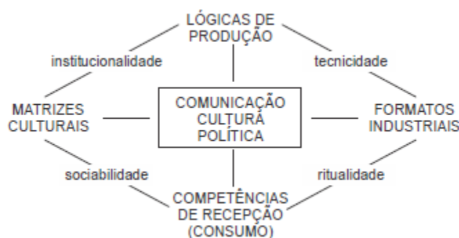
Figura 1: Reprodução do Mapa das Mediações

Abaixo, o mapa do pensamento teórico de Barbero (figura 1). As relações entre as Matrizes Culturais e as Lógicas de Produção são mediadas por distintos regimes de institucionalidade. As relações entre as Matrizes Culturais e as Competências de Recepção e Consumo estão mediadas por diversas formas de socialidade. Entre as Lógicas de Produção e os Formatos Industriais estão as tecnicidades e, finalmente, as ritualidades medeiam os Formatos Industriais e as Competências de Recepção/Consumo (MARTIN-BARBERO, 2002, p. 227). Neste esquema, as mediações empíricas são lógicas da produção, matrizes culturais, competências de recepção e formatos industriais e os distintos conceitos de mediação estão a ligar objetos, lugares, processos concretos. (RONSINI, 2010).