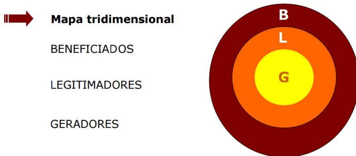
Figura 4: Mapa Tridimensional dos públicos

A partir disso, os autores apontam para uma visão de públicos em três níveis, conforme exposto na figura 4, e que se relaciona com ideia de escala de vínculos (figura 3).