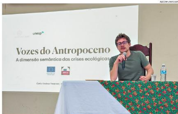
Tassinari: conflitos de classificações moldam a sociedade via mecanismos semióticos

DISCURSO - Pesquisador da Universidade de Bolonha defende a desconstrução da retórica ambiental que não transforma