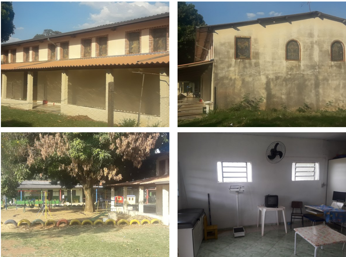
Figura 1 - Imagens da Creche São Jerônimo Emiliani

Em 31 de maio de 2017 apresentamos a proposta à equipe dirigente da Creche Comunitária São Jerônimo Emiliani, que foi acatada prontamente, sendo asseguradas as devidas condições objetivas para sua realização. Ao final de nossa exposição, a coordenadora solicitou-nos priorizar as crianças que apresentavam dificuldades cognitivas e haviam se matriculado após o início do ano letivo. Na verdade, a coordenadora atribuía os “déficits” de aprendizagem das crianças ao fato de haverem mudado de escola.