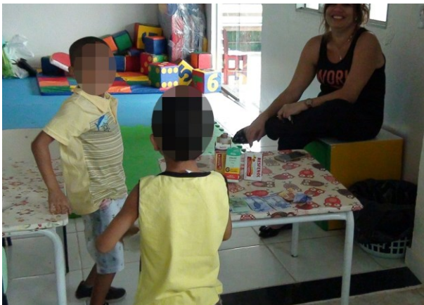
Figura 11 - Apropriando e significando as relações sociais