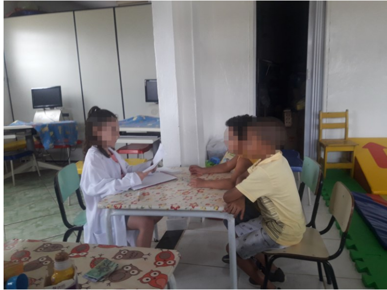
Figura 10 - As relações humanas como conteúdo da brincadeira