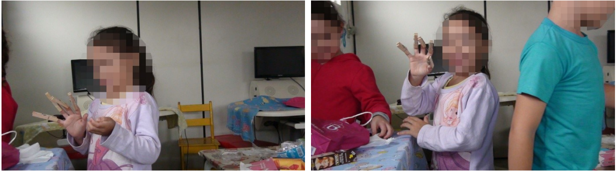
Figura 7 - Ação simbólica com objetos substitutivos