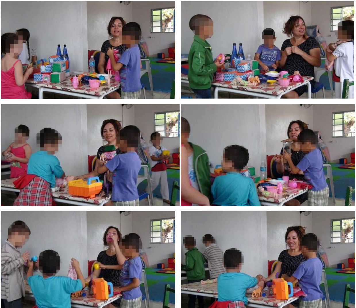
Figura 3 - Início da realização da brincadeira com objetos temáticos

Observamos que, quanto maior é a quantidade de objetos temáticos presentes no ambiente, menores são as possibilidades de criação e de inter-relação entre os sujeitos na atividade. Cada criança se ocupa apenas de manusear os objetos que estão disponíveis, com limitados atos de criação. Isso parece indicar que a simples presença dos objetos temáticos no ambiente não garante as possibilidades de desenvolvimento de ações criativas com estes, apresentando-se, ao contrário disso, uma simples reprodução das ações humanas conhecidas.