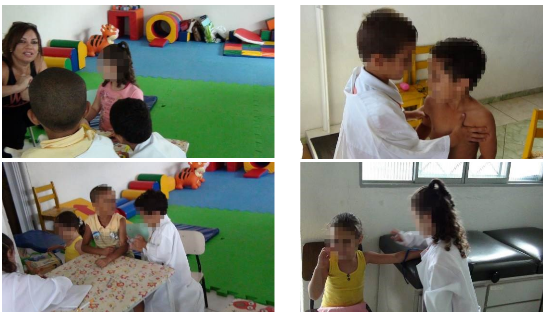
Figura 13 – O signo verbal como instrumento para construção do enredo na brincadeira de papéis sociais

Na Figura 13, as imagens mostram alguns dos momentos que denotam a evolução da atividade, a qual partiu das ações lúdicas com objetos temáticos em direção à protagonização do papel pelo uso da palavra, prescindindo do objeto material para sua realização. O signo/palavra representa essa materialidade. O uso da palavra em substituição ao objeto na realização da brincadeira de papéis sociais demarca o modo superior de objetivação da unidade mínima de análise da atividade, que é a necessidade convertida em motivo da ação, mediada pela linguagem.