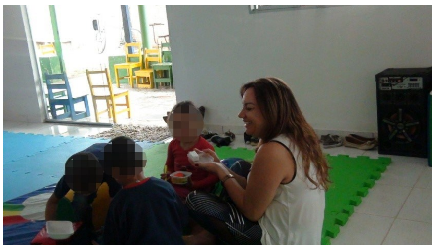
Figura 6 - Brincando de "Família"