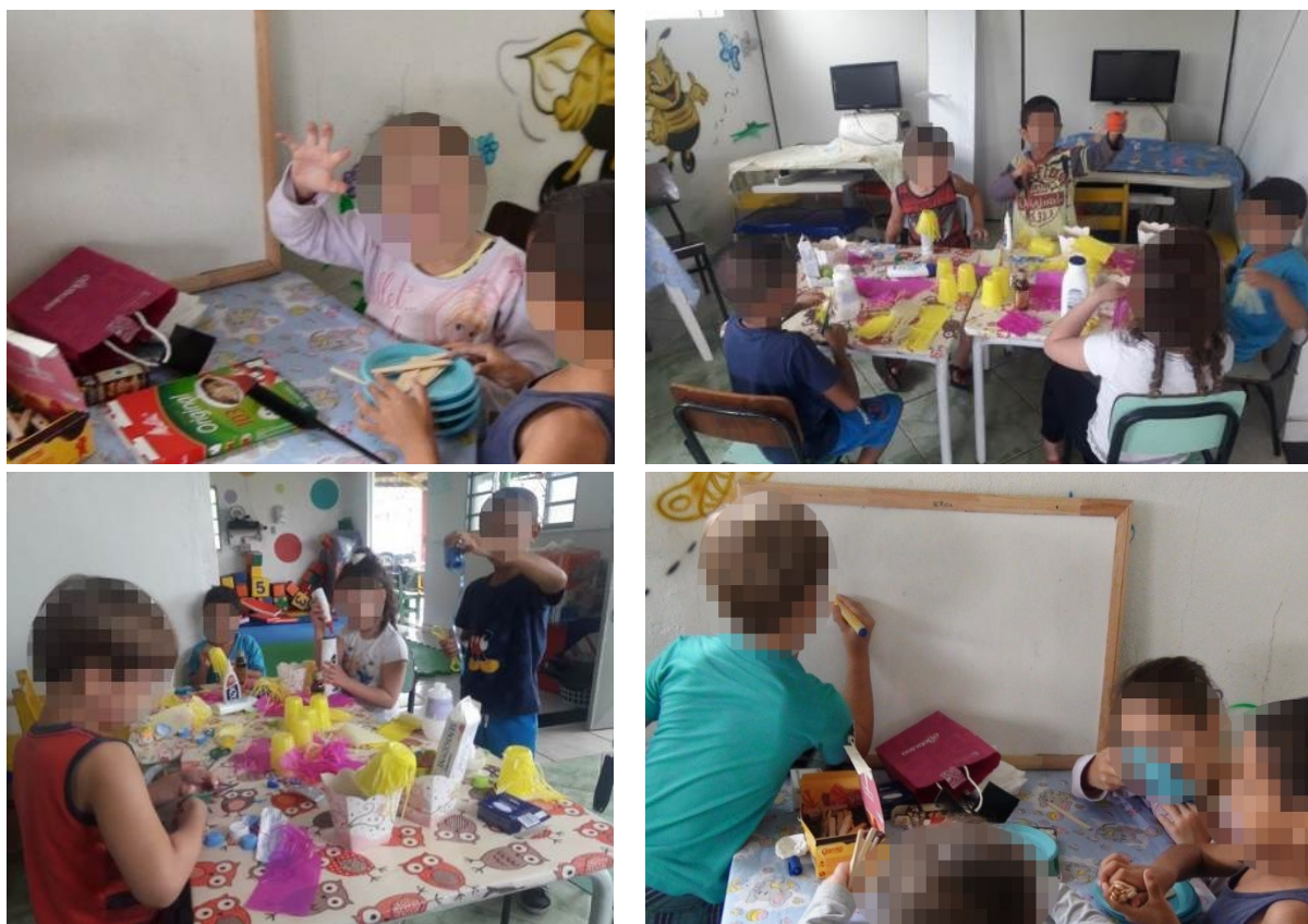
Figura 5 - Misturando diferentes objetos como possibilidade de novas combinações criadoras

A verificação da necessidade de incluir novos objetos na atividade da brincadeira representou um dado fundamental sobre a ação mediadora do professor na organização do espaço e dos materiais necessários. Em um dos encontros, as crianças escolheram brincar com os objetos não temáticos e produzir uma festa de aniversário, o que possibilitou a criação de novos argumentos, novas relações que influíram na escolha dos papéis. Esse dado apresenta os indícios da unidade entre o papel, as ações e os objetos na brincadeira de papéis sociais e nos permite atentar para as mudanças que vão ocorrendo entre esses elementos na própria evolução da atividade.