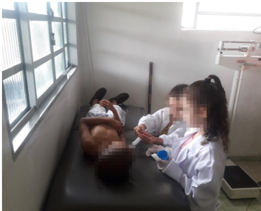
Figura 9 - O enredo é imaginário, mas o sentimento é real