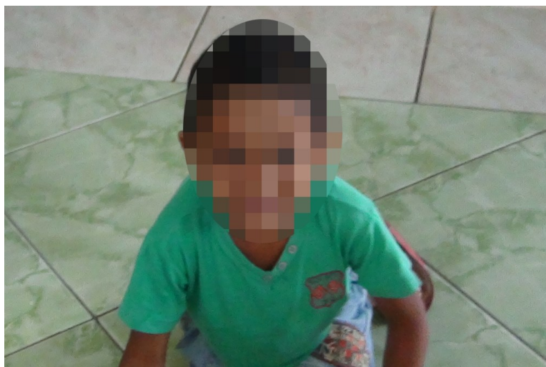
Figura 14 – Mateus protagoniza um gato