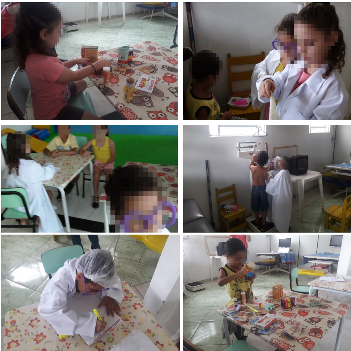
Figura 8 - A escolha dos papéis sociais e as trocas consensuais

internação do paciente, a cozinheira que fazia alimentação, o guarda responsável pela segurança, o diretor do hospital, entre outras funções sociais que não chegaram a ser reproduzidas pelas crianças, mas que lhes foram apresentadas.