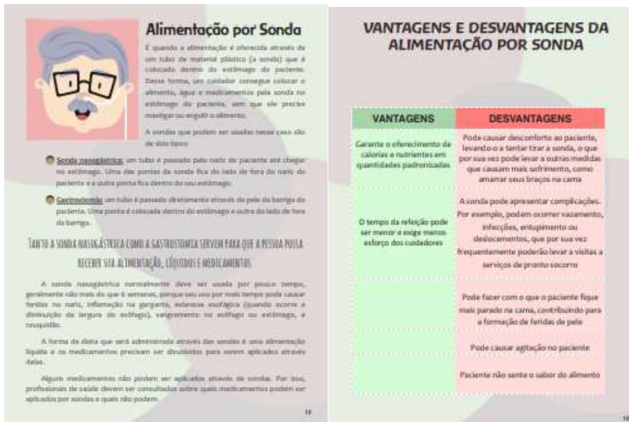
Figuras 12 e 13. Alimentação por sonda e suas vantagens e desvantagens.