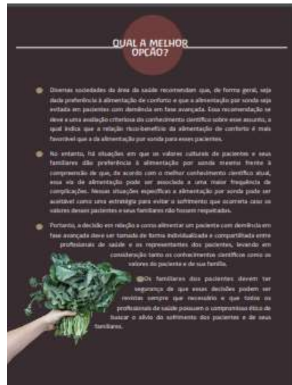
Figuras 15, 16 e 17. Mitos sobre a alimentação por sonda para pacientes com demência em fase avançada.