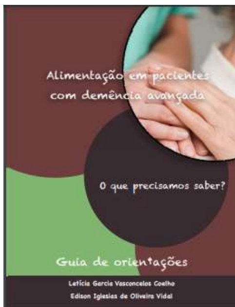
Figura 2. Apresentação, versa sobre o objetivo do e-book.