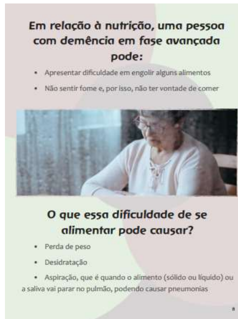
Figura 9. Apresenta as opções relacionadas às vias de alimentação para pacientes com demência avançada.