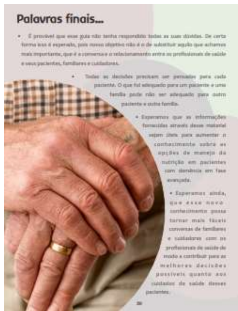
Figura 20. Palavras finais.