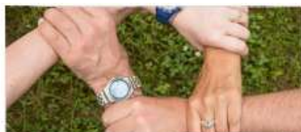
Figura 19. E agora, o que fazer na prática com o que aprendi? Fala aos familiares e cuidadores sobre como podem aplicar o que aprenderam com o e-book.