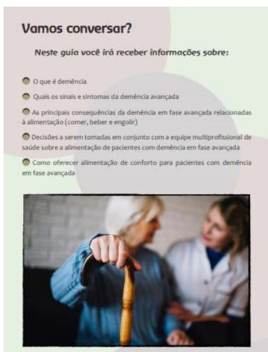
Figuras 5, 6 e 7. Versam sobre o que é Demência, quais os tipos e os sinais da demência em fase avançada.