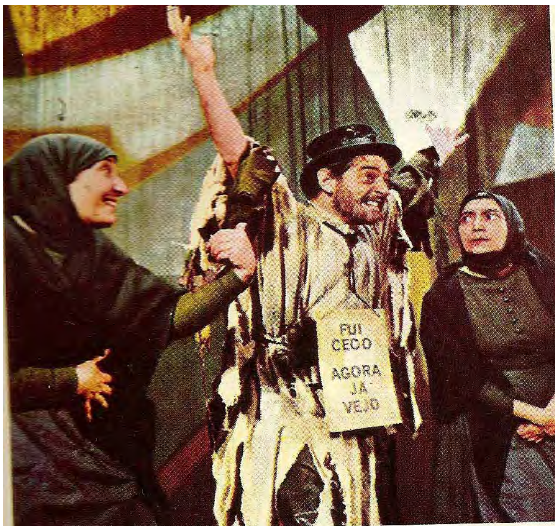
Figura 1 - O Cego e as Duas Comadres Fonte: Cardoso Pires, 1970 44

Um acontecimento ocorrido fora de cena insere na peça um momento de tensão dramática. Trata-se do assassinato do noivo de Maria Ricarda, o Acadêmico. A notícia chega à tropa de Alexandre, no Vilar, deixando Maria Ricarda transtornada a ponto de ela escrever uma carta ao pai, Dr. Silveira, insinuando que cometerá suicídio – mas isso de fato não acontece, como verificamos na primeira cena da terceira parte.