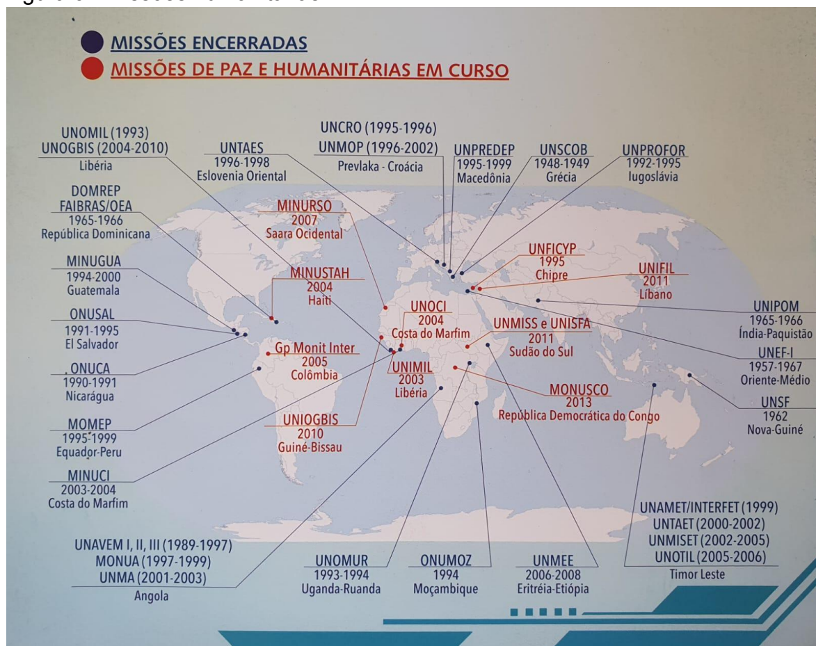
Figura 3 - Missões humanitárias