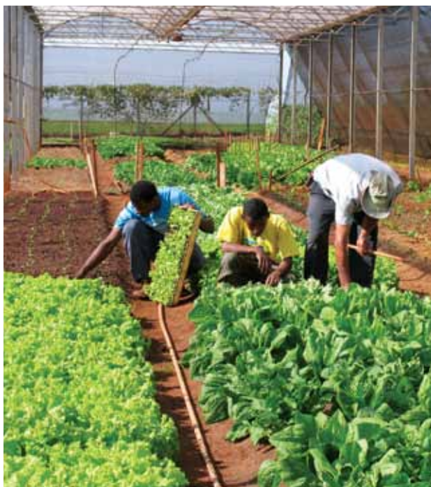
Projetos de extensão integram ensino e pesquisa