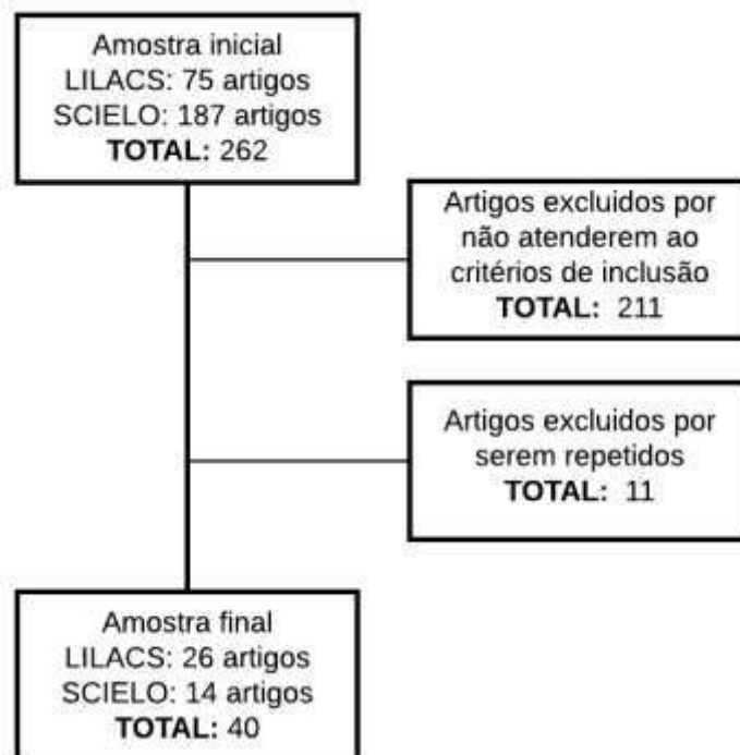
Figura 1. Fluxograma de seleção da amostra de artigos que enfocam Gênero e Saúde na atenção primária

Foram adotados os seguintes critérios de inclusão: estudos realizados na atenção primária brasileira, disponíveis na íntegra no idioma português, inglês ou espanhol, em periódicos nacionais e internacionais, indexação nas bases de dados referidas e sem recorte temporal. Já os critérios de exclusão foram: dissertações de mestrado, teses de doutorado, estudos repetidos e estudos que não correspondem ao objeto de pesquisa. As buscas nas bases de dados foram realizadas no período de agosto a novembro de 2019. A partir disso, foram encontrados 262 artigos. Desses estudos, 211 não correspondiam aos critérios de inclusão e 11 estavam repetidos, sendo o corpus de análise composto por 40 artigos. Conforme descrito na figura 1.