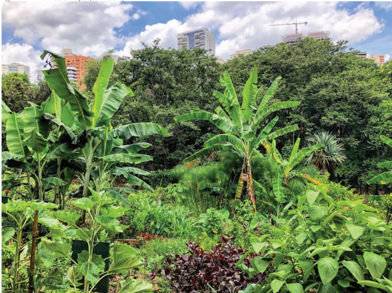
Figura 1: Horta das Corujas (São Paulo)

gramas públicos concernentes à diversidade de práticas da agricultura urbana. Na cidade de São Paulo, as primeiras materializações do tipo datam da década de 2010 e ganharam destaque a partir de articulações cidadãs não institucionalizadas, especialmente a partir do surgimento da rede dos Hortelões Urbanos e da Horta das Corujas – a primeira horta comunitária da cidade, situada no bairro da Vila Beatriz, na zona oeste da cidade (figura 1) –, que impulsionaram, por sua vez, transformações na maneira como os diversos atores compreendem este tipo de organização espacial no conjunto de expressões da agricultura urbana (NAGIB, 2020).