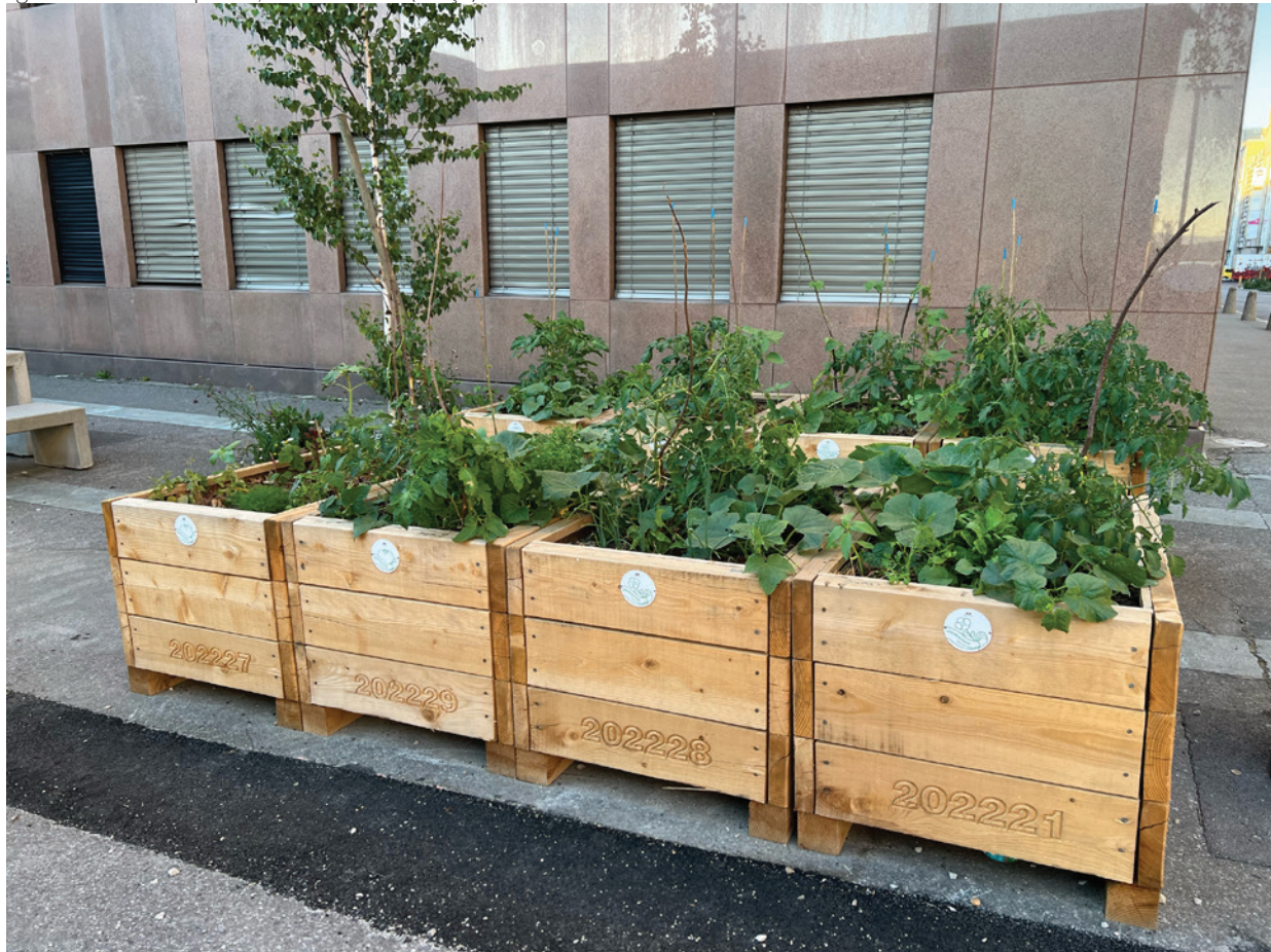
Figura 5: Jardim de poche, em Lausanne (Suíça)