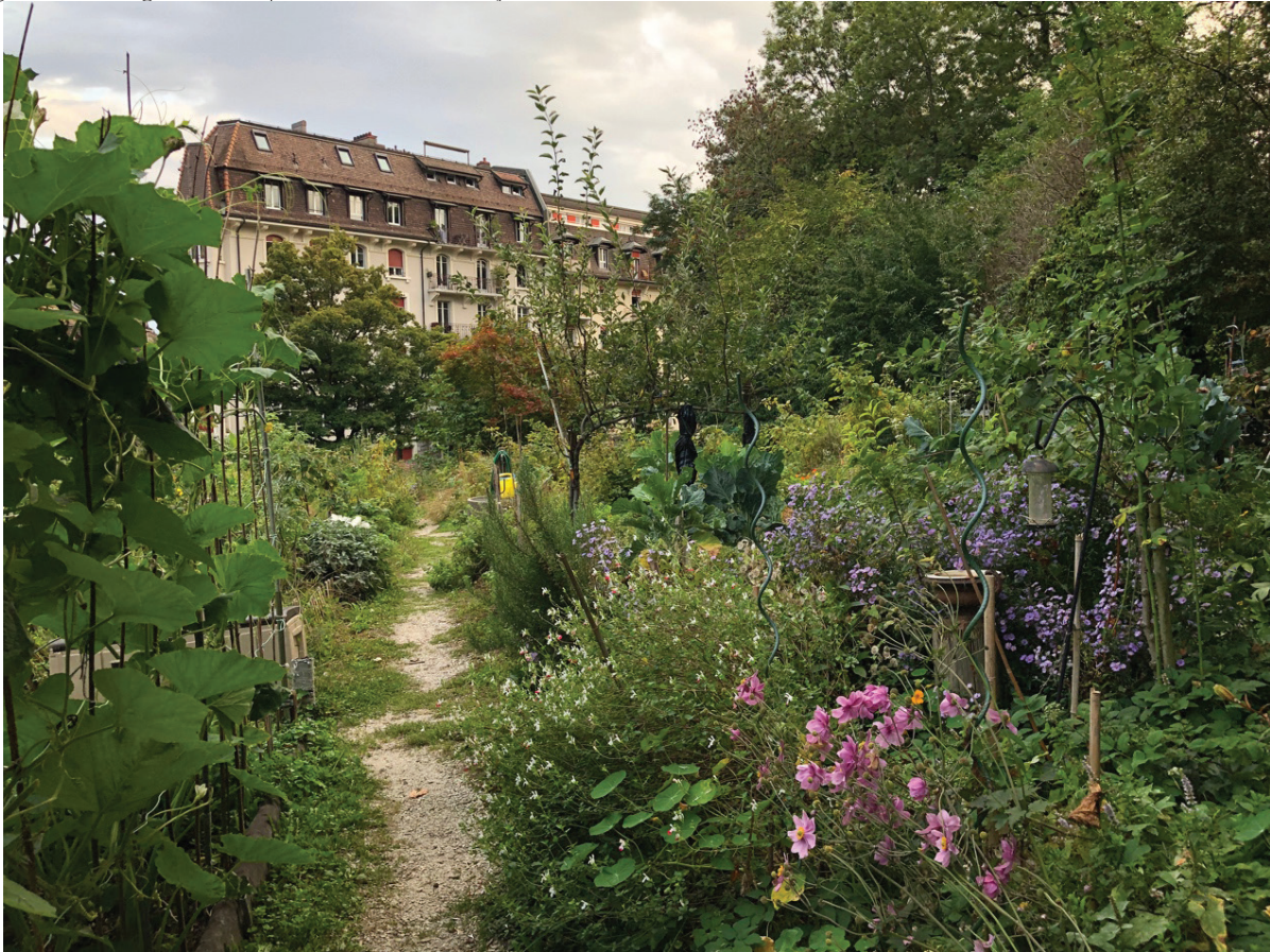
Figura 4: Plantage de la Harpe, em Lausanne (Suíça)