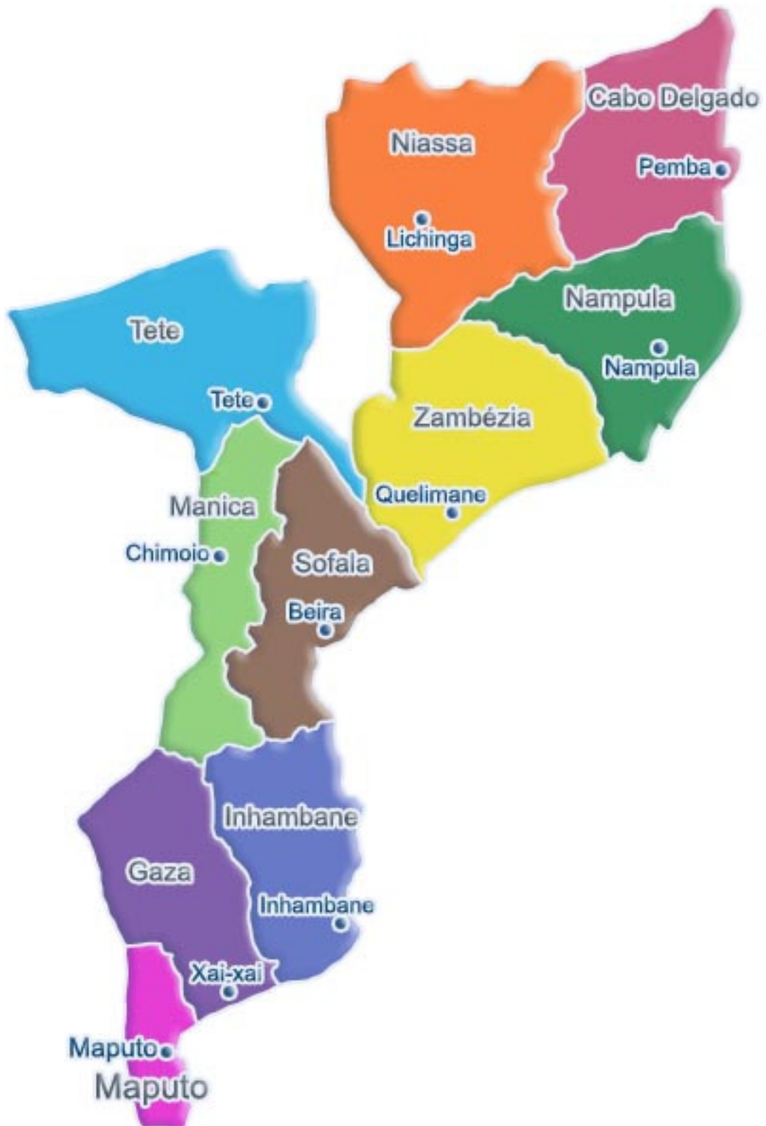
Mapa 1. Moçambique