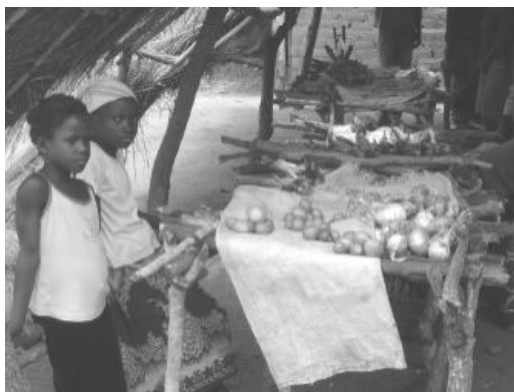
Foto 6. Meninas Moçambicanas- trabalho infantil. 43

Este contexto foi agravado nos anos de luta de libertação associado à guerra civil. Devido aos movimentos de deslocamento feminino, de migração do campo para as cidades, associado às dificuldades de produção agrícola ocasionadas por efeitos climáticos, períodos prolongados de seca ou de chuvas, e dos combates. Em busca de melhores condições de vida nas cidades, as mulheres que iam à busca de trabalho nos centros urbanos, e tinham a sua integração dificultada pela falta de formação educacional e profissional, produzindo a inserção marginal na economia e na ilegalidade.