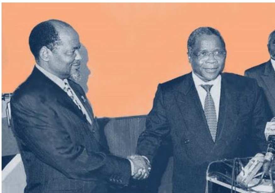
Foto 5. Joaquim Chissano e Afonso Dhlakama 41

O início do processo de paz ocorreu em 8 de julho de 1990 e só foi encerrado no dia 04 de outubro de 1992, em Roma, com o presidente de Moçambique, Joaquim Chissano e o chefe da guerrilha anti-governista, Afonso Dhlakama assinando os termos do acordo.