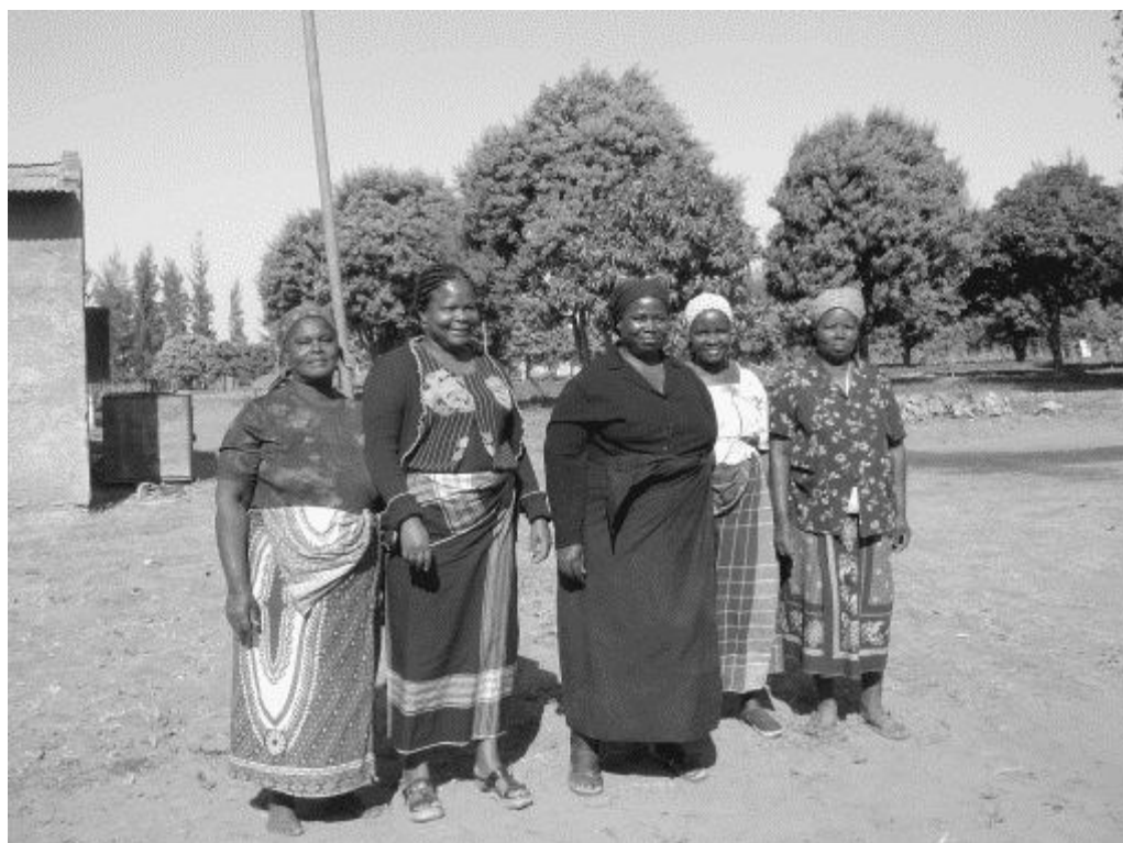
Foto 9. Mulheres Moçambicanas

social a qual estão inseridas as meninas no presente momento. Acreditamos ser factível esta produção acadêmica devido à presença no país de organizações não-governamentais internacionais, as quais trabalham com foco na infância, que já vem desenvolvendo ações neste sentido e com as quais mantemos contato direto, enquanto parceiros, e como colaboradora da SOS Children's Villages no Brasil (Aldeias Infantis SOS Brasil) presente também em Moçambique.