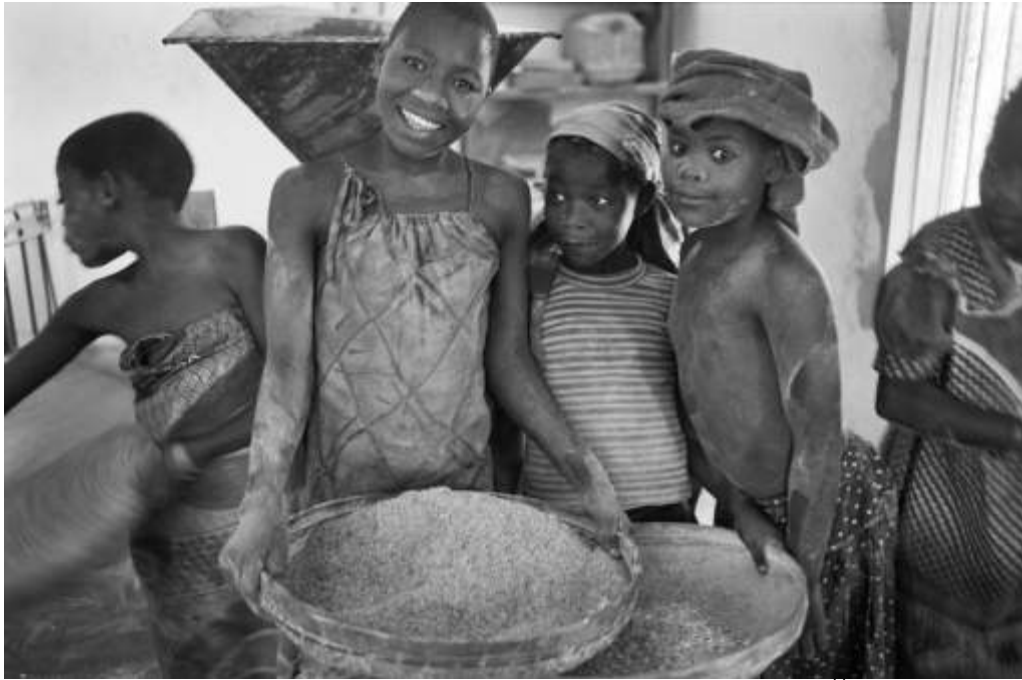
Foto 7. Meninos e meninas moçambicanos -trabalho infantil. 44

Num processo de imitação das mães, tias e avós, as raparigas aprendem, por um lado, a responder às expectativas mas, por outro lado, a exposição e a inclusão em outros meios de pertença e referência permite-lhes renovar as identidades. A este fenómeno não é alheio o contexto da modernidade que leva os adultos a projectarem sobre si próprios uma imagem mais permissiva. Se a fluidez na construção das identidades dos jovens é comum a raparigas e rapazes, é certo que são infinitamente grandes os conflitos vividos pelas jovens entre estruturas e modelos de socialização.