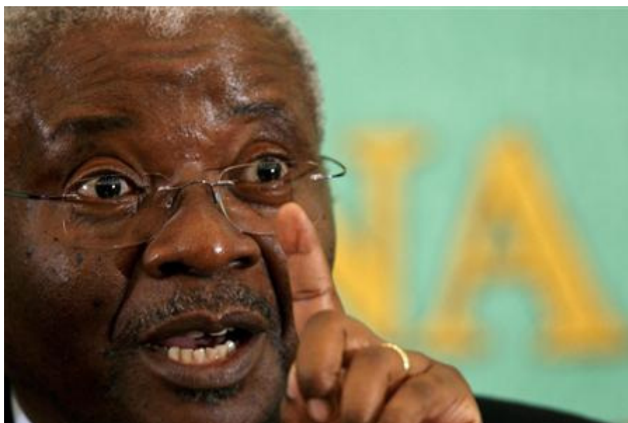
Foto1. Presidente Armando Emílio Guebuza 5

Moçambique hoje é um país democrático, presidido por Armando Emilio Guebuza. O sistema político vigente é o presidencialismo, mas além da figura do presidente encontramos a do primeiro ministro. O poder legislativo é exercido pela Assembléia da República com 250 deputados, eleitos por sufrágio direto e universal.