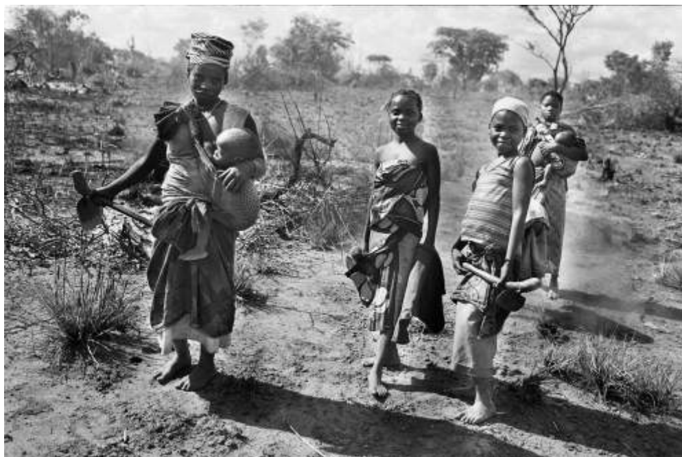
Foto 8. Alto índice de natalidade em mulheres de Moçambique 45

familiar ou aborto clandestino, podem teoricamente deixar de ser condicionadas pelo ciclo de vida que as leva à maternidade.