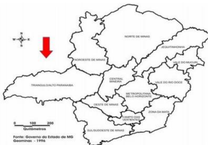
MAPA 1- Minas Gerais – Divisão mesorregional

O Laboratório de Geografia Agrária- LAGEA 20 , a partir do seu banco de dados DATALUTA, organiza e apresenta seus dados tendo como critério de delimitação regional da pesquisa, a divisão elaborada pelo IBGE, no qual o Estado de Minas Gerais está dividido em 12 Mesorregiões e 66 Microrregiões Geográficas, conforme a figura abaixo: