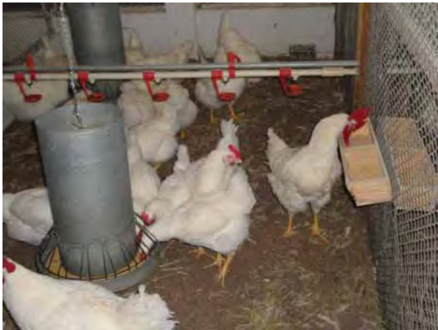
Figura 3: Comedouros tubulares para fêmeas com grade exclusora e comedouro tipo calha para machos.

As matrizes ficaram submetidas aos tratamentos até a 18ª semana de idade, após este período todos os animais foram alimentados sob restrição diária. A ração foi pesada semanalmente e separada em sacos plásticos para ser fornecida durante a semana. Em caso da ocorrência de mortalidade em determinado box, a quantidade de ração a ser fornecida para aquela parcela foi corrigida de modo a se manter a quantidade em g/ave/dia previamente estipulada. As fêmeas tiveram acesso ao alimento em comedouros tubulares com grades de exclusão e os machos de comedouros do tipo cocho fixados nas paredes dos boxes, ambos obedecendo o espaço de comedouro recomendado pelo Manual da Linhagem (Figura 3). Os animais tiveram acesso contínuo à água por meio de bebedouros do tipo “ nipple ”.