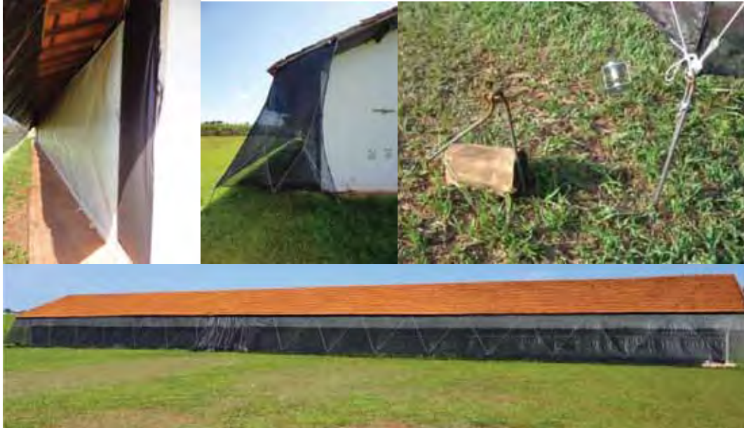
Figura 2: Fotos do Galpão equipado com sistema de penumbra.

(Figura 2), visando reproduzir as características obtidas em matrizeiros comerciais, do Setor de Reprodução de Aves do Departamento de Zootecnia da Faculdade de Ciências Agrárias e Veterinárias da Universidade