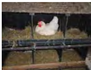
Figura 1: Ninho

Neste experimento 1400 matrizes pesadas da linhagem Cobb 500 ® e 200 machos, com 1 dia de idade, foram criados separadamente até os 31 dias de idade em 54 boxes de 3,36 x 2,06m, contendo um ninho com 6 bocas de 30 x 30 x 30cm (Figura 1) cada. Foi utilizado galpão experimental equipado com sistema de