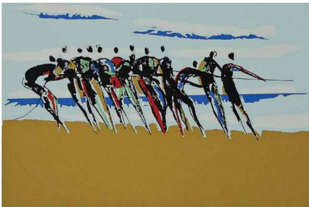
Figura 5 – Quarto item da coleção 10