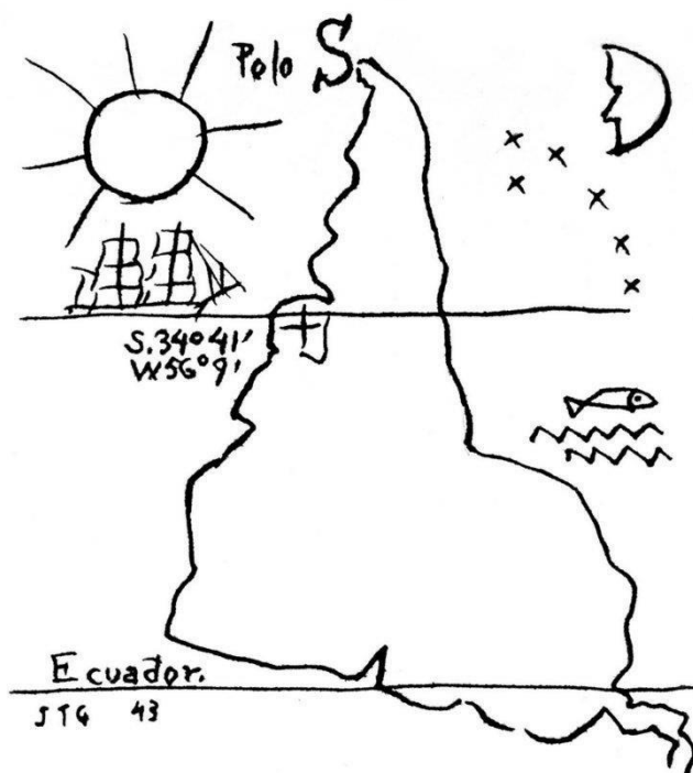
Figura 4 – Quarto item da coleção 9