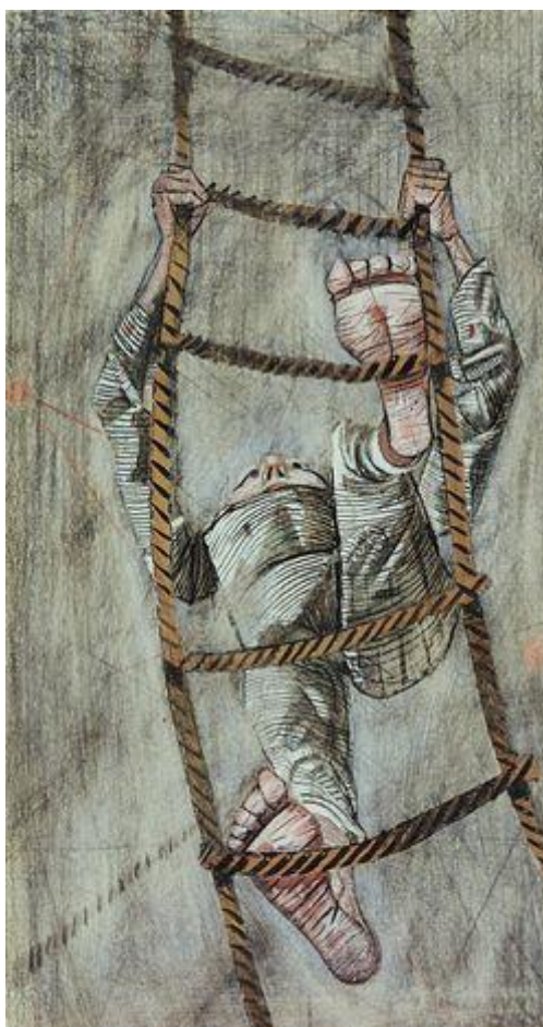
Figura 3 – Terceiro item da coleção 8

Fonte: Disponível em: www.portinari.org.br/#/acervo/obra/427/detalhes . Acesso em: 12 abr. 2021