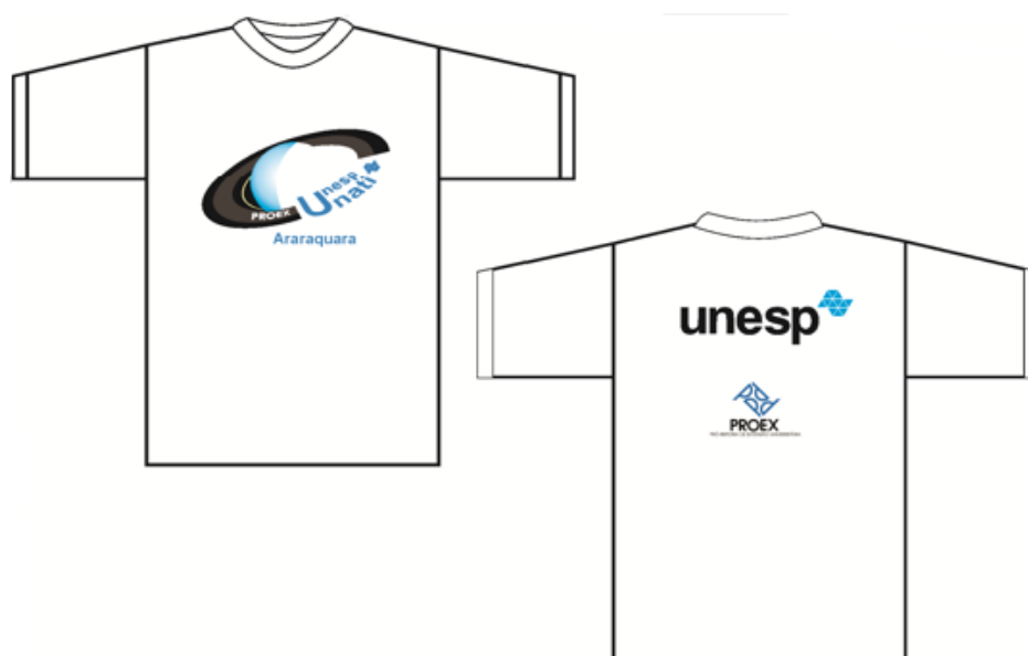
Figura 2: Camiseta de identificação do participante da UNATI/UNESP/Araraquara 9

Assim, a identificação dos alunos participantes é feita a partir de um crachá com o nome completo do inscrito, como também pelas camisetas, ambos com o logotipo da