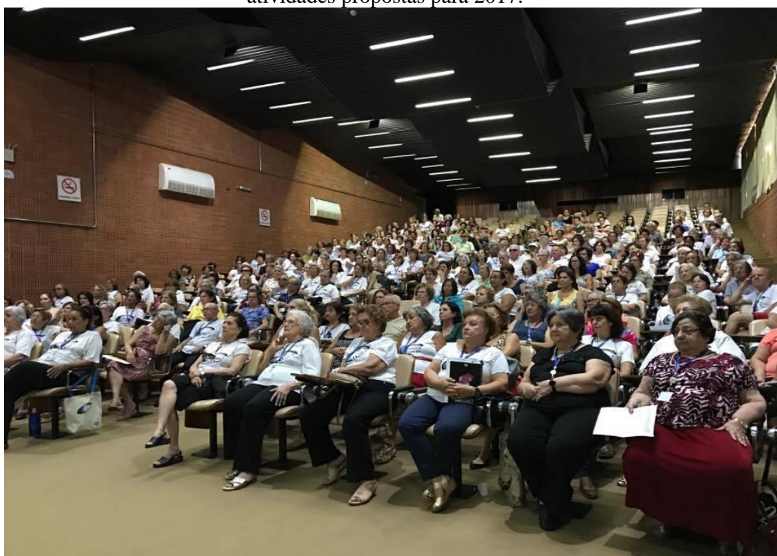
Figura 5: Primeira reunião da UNATI de 2017, em 21 de março, no Anfiteatro da Faculdade de Odontologia.