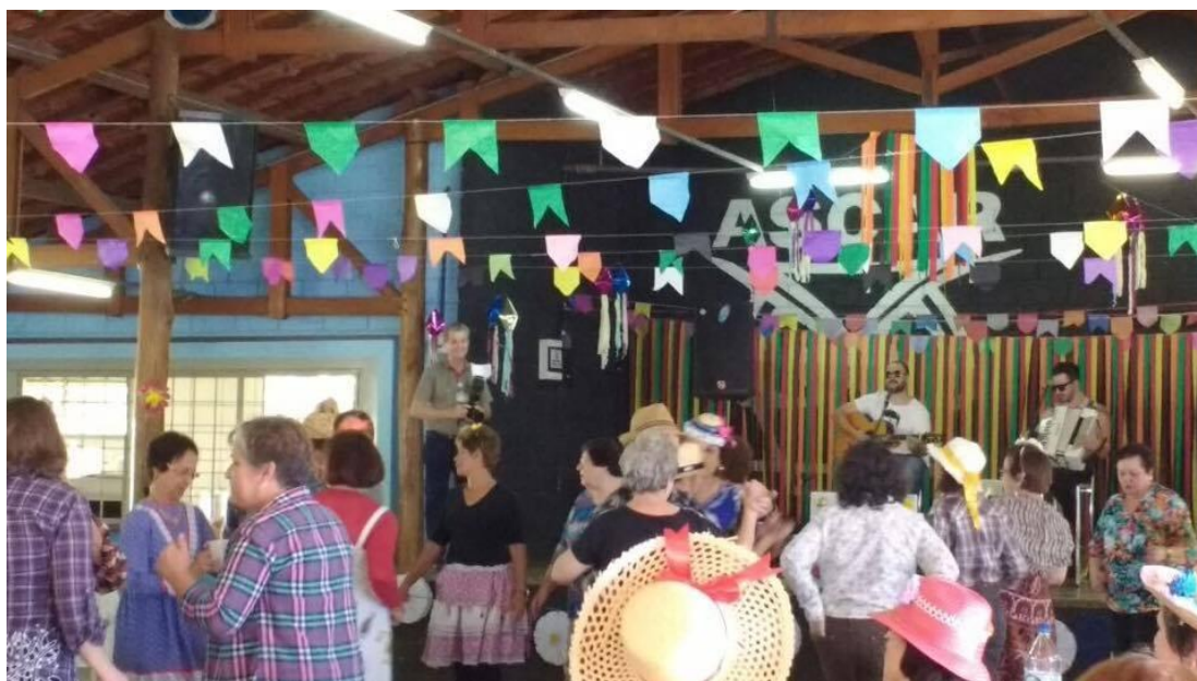
Figura 19: Festa Junina da UNATI na ASCAR – 27/06/2017.