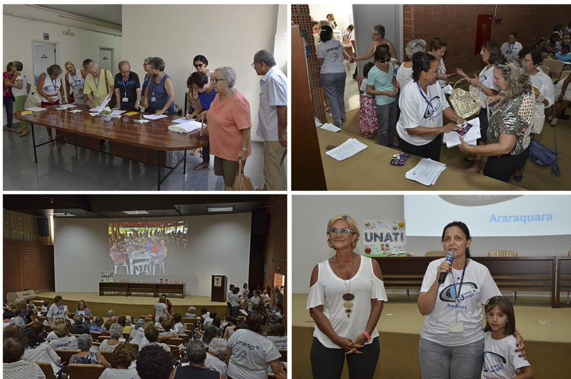
Figura 4: Recepção dos participantes, controle de frequência e apresentação das atividades propostas para 2017. 10