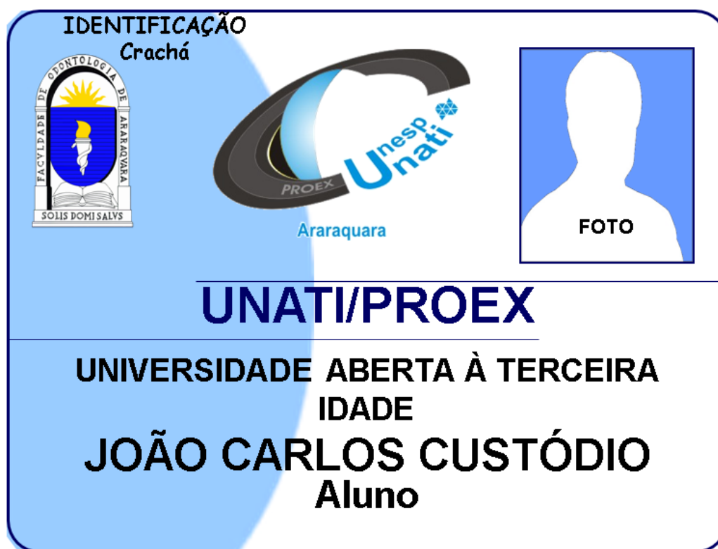
Figura 1: Crachá de identificação do participante da UNATI/UNESP/Araraquara 8