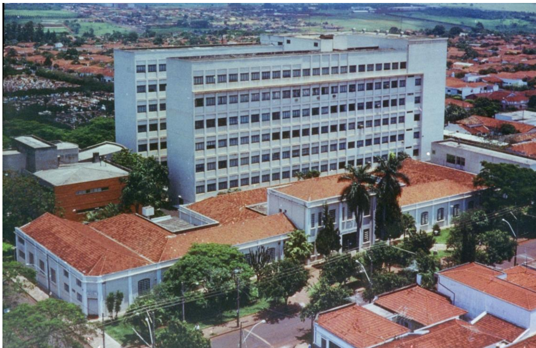
Figura 3: Prédio da Faculdade de Odontologia na região central de Araraquara

UNATI. A aquisição da camiseta não é obrigatória, ao contrário da utilização do crachá, pois seu uso facilita a identificação dos alunos na portaria da Faculdade de Odontologia.