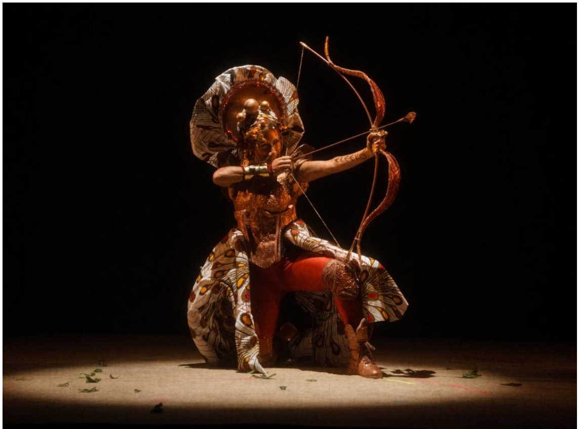
Imagem 4 - Obá de Eleeko

Inicia-se no escuro. Aos poucos pontos luminosos vão surgindo, e na tela forma-se um símbolo geométrico sagrado. A personagem narradora, Olorum, é apresentada ao público. Em seguida, uma definição do feminino pelas Yabás é oferecida, gerando uma reflexão sobre masculino e feminino. É então que o motivo da seca nas terras de Obá é revelado. Olorum conta que: “houve um tempo em que as mulheres eram respeitadas por guardarem o segredo da vida, mas quando a humanidade se esqueceu disso as águas secaram e tudo foi secando à sua volta.” (Sergio, 2018, p. 1)