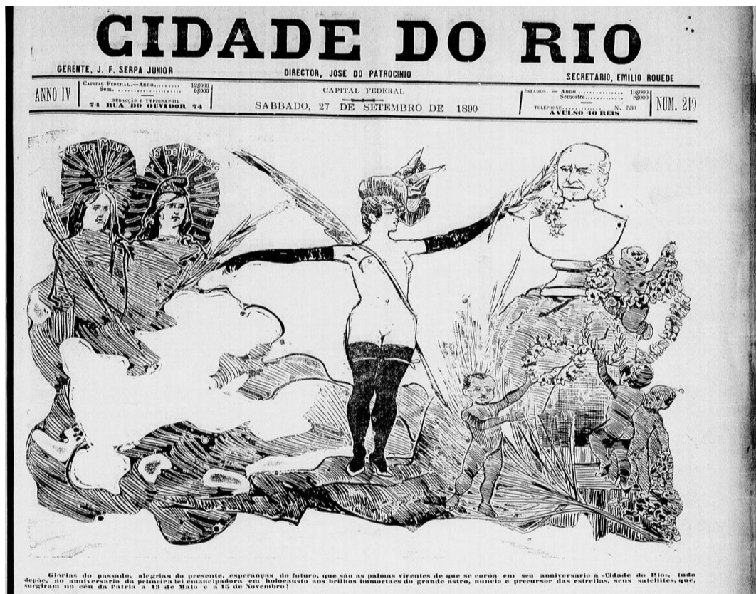
Figura 4 - Representação da República e da Abolição

Fonte: Cidade do Rio , 27 de setembro de 1890, Hemeroteca Digital 87