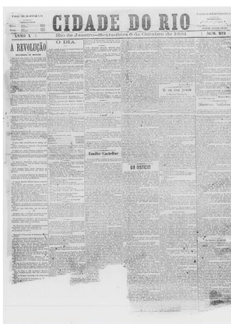
Fonte: "Cidade do Rio", 6 de outubro de 1893. Hemeroteca Digital. 9

No Brasil, a questão da escravidão e a racial foram debatidas por diversas áreas do conhecimento. No campo da História, as discussões dentro dessa temática estão presentes em diferentes temporalidades, que se iniciam com o desenvolvimento de um modelo econômico, baseado na servidão compulsória. É somente no século XIX que a escravidão passa a ser questionada no Brasil e combatida por diversos grupos