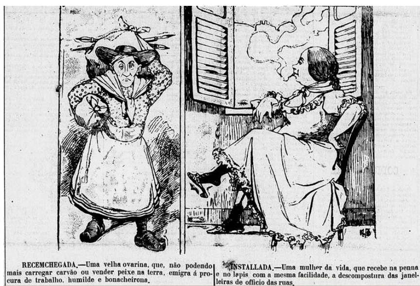
Figura 6 – “Cosmorama – A imprensa de arribação”.