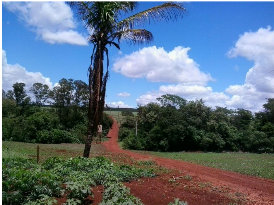
IMAGEM 4: Estrada que dá acesso ao rio Taquaruçuzinho