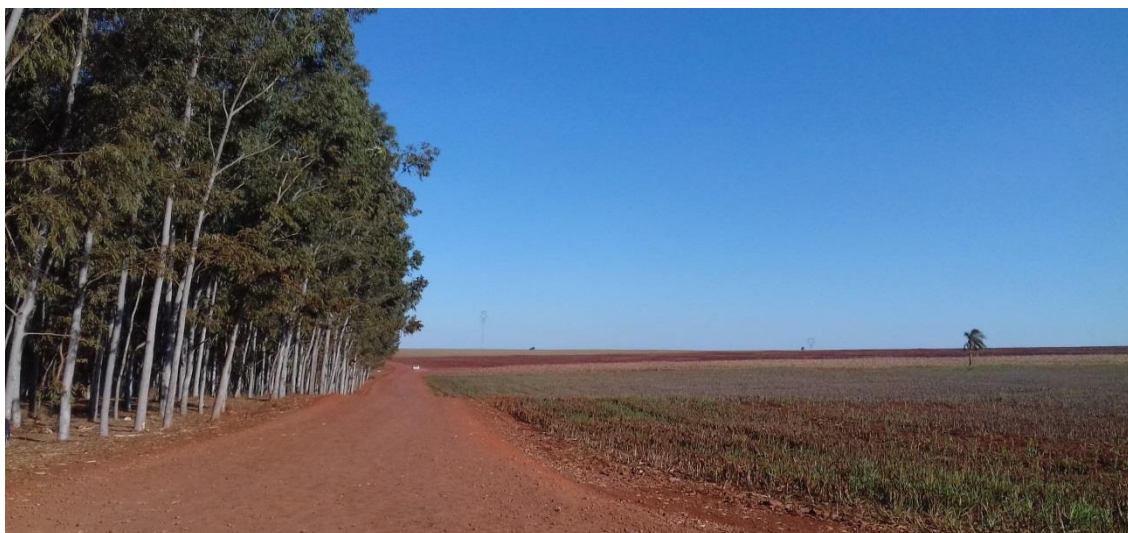
IMAGEM 3: Início da estrada de terra do bairro Taquaruçuzinho