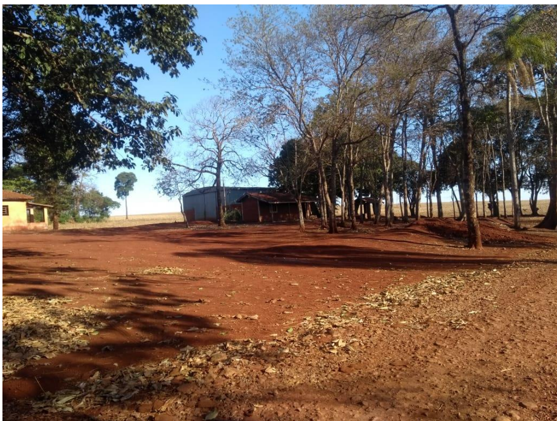
IMAGEM 33: Galpão de maquinários.