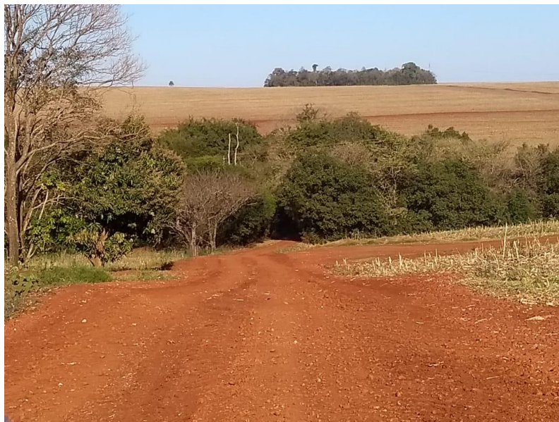
IMAGEM 22: estrada que dá acesso ao sítio da família Corrêa