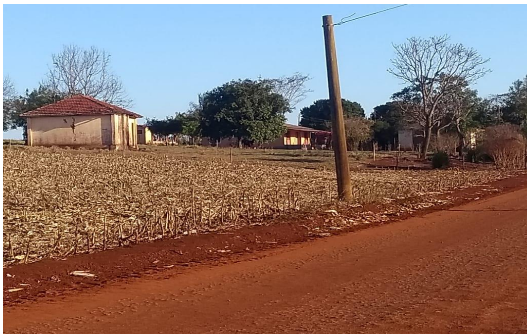
IMAGEM 17: A antiga escola primária do bairro rural Taquaruçuzinho, atualmente desativada.