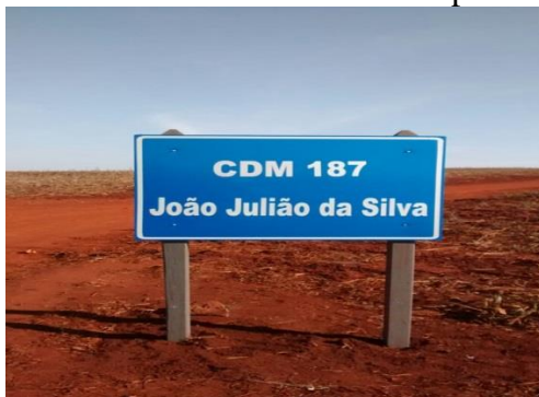
IMAGEM 10: Placa que indica o nome da estrada no bairro rural de Taquaruçuzinho, localizado no Distrito de Frutal do Campo –SP.

A importância desta região está intercalada com a história do distrito de Frutal do Campo, a povoação, tanto do distrito quanto das regiões das Águas, contam atualmente, em média 30 famílias, que permanecem no campo, alguns mais na região do Taquaruçu e Taquaruçuzinho. Porém ainda ocorre a transição de pessoas para a cidade, seja de famílias inteiras ou somente algum membro, como os filhos, primos, irmãos, o que muitas vezes se dá pela falta de recursos financeiros para manter a propriedade ativa no mercado.