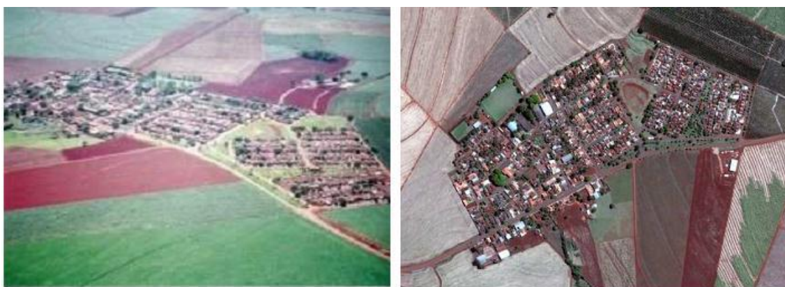
IMAGEM 7: Vista panorâmica do distrito de Frutal do Campo.

crescimento populacional urbano do Distrito de Frutal do Campo. Foi observado que o modelo estatisticamente apresentado ajustou de forma linear uma possível equação que estima a população urbana do Distrito de Frutal do Campo do município de Cândido Mota em função do ano de interesse. Os resultados obtidos por este estudo indicam que em 2020, a população urbana estimada pelo modelo linear para o distrito ficará em 1.072 habitantes. Para 2042, a projeção feita pela SAAE estimou-se o número chegará a 497 habitantes urbanos no distrito de Frutal do Campo. A conclusão do documento aponta para uma tendência de diminuição da população que reside na área urbana do distrito. Na região rural de Frutal do Campo a estimativa populacional de 2000 era de 607 habitantes, em 2010, esse número cai para 381 habitantes. Conclui-se nesta pesquisa de 2013, que não existe tendência de crescimento populacional.