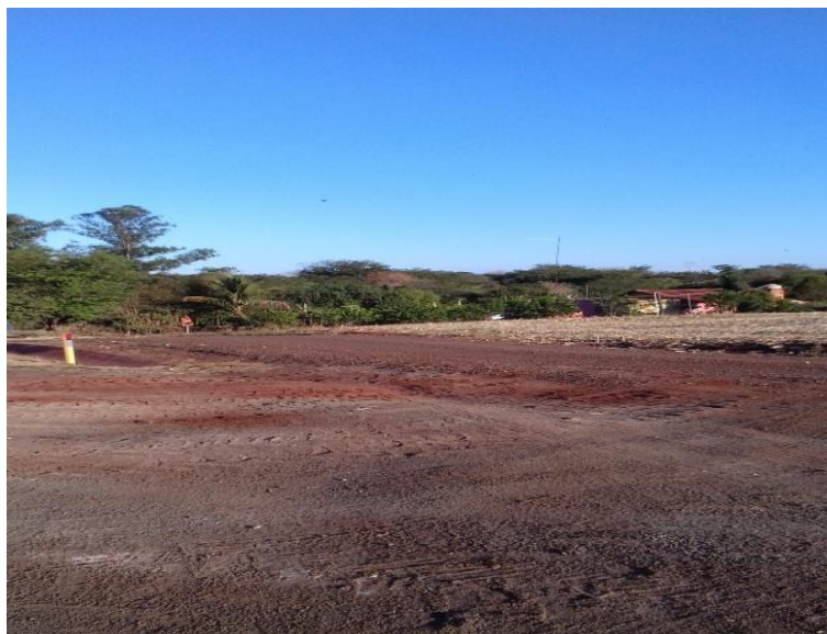
IMAGEM 13: lateral da propriedade da Senhora P.

Para preservar a identidade dos entrevistados foi fotografado apenas o que diz respeito à propriedade, longe das casas para manter a privacidade dos entrevistados como foi escolhido por eles no ato da entrevista.