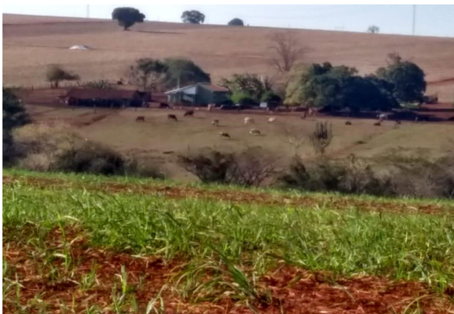
IMAGEM 32: Outra propriedade com a criação de animais.