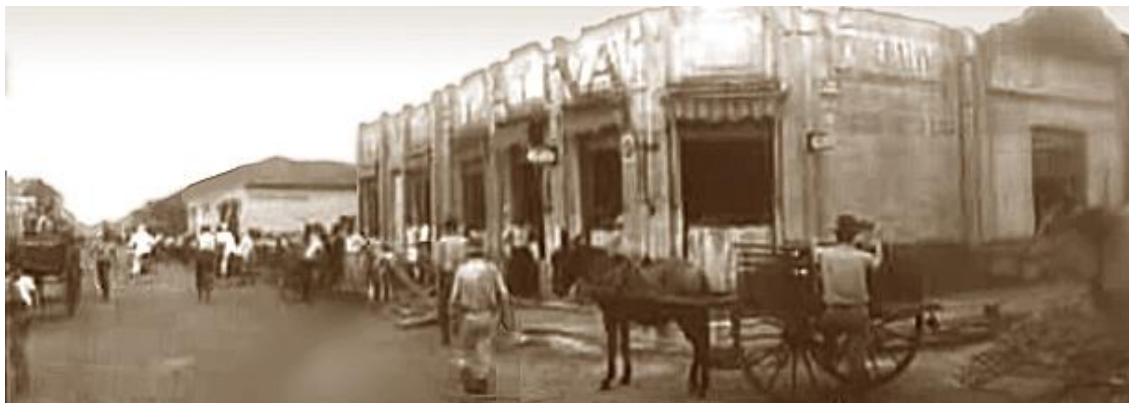
IMAGEM 2 - A Cooperativa Agrícola Mixta de Candido Mota, 1950