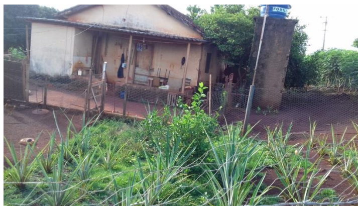
IMAGEM 30: Pequena plantação de abacaxi.