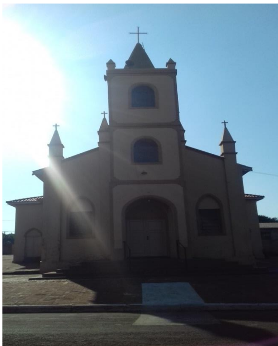
Imagem 9: frente da Igreja Matriz