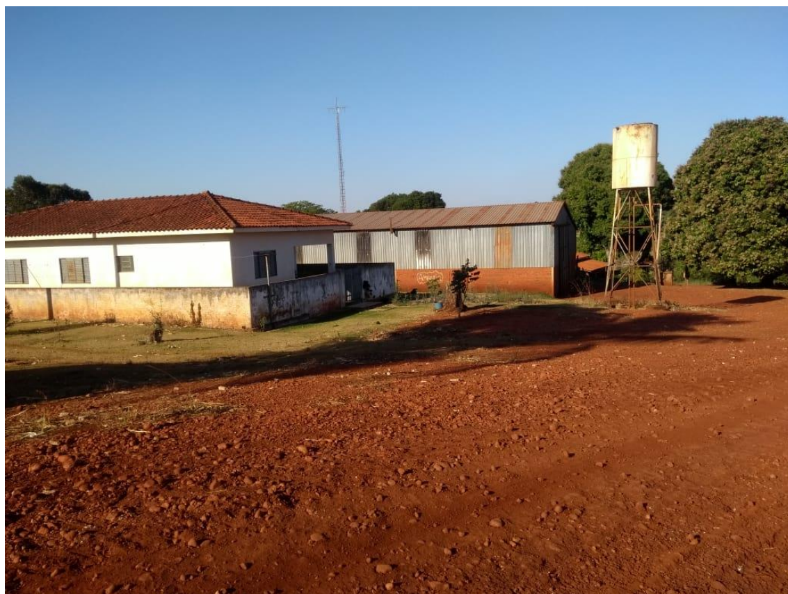
IMAGEM 24: Casa de um dos membros da família