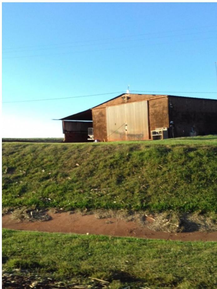
IMAGEM 15: Galpão na propriedade da família.