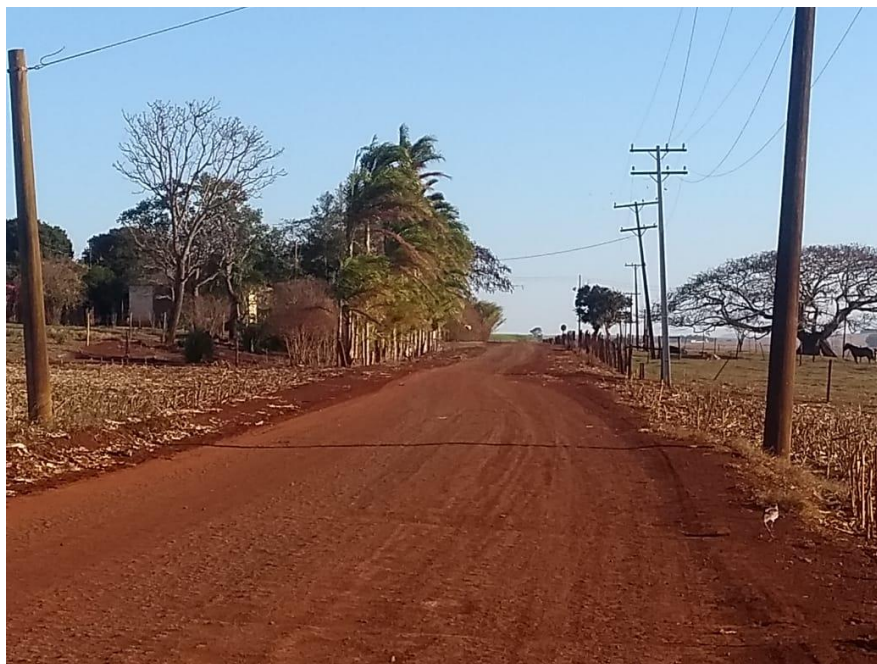
IMAGEM 16: Estrada que dá acesso a propriedade localizada no lado esquerdo da foto.