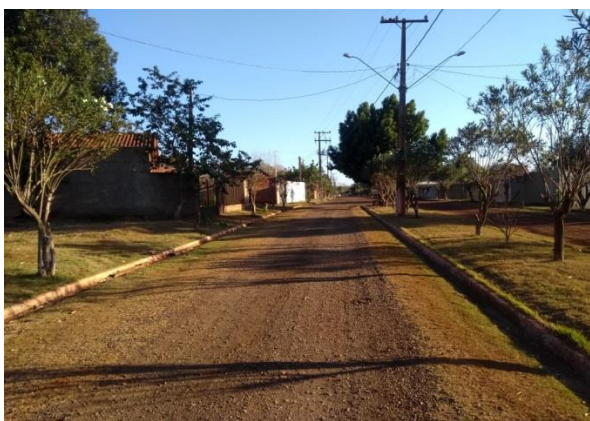
IMAGEM 19: interior do condomínio