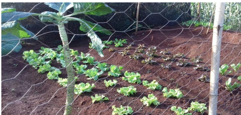
IMAGEM 29: Horta cultivada pelo arrendante.