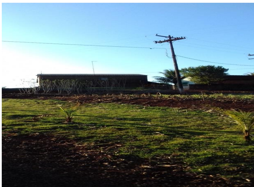
IMAGEM 14: Propriedade da Senhora P.