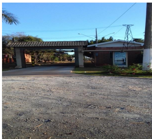
IMAGEM 20: frente do condomínio Portal das Águas.