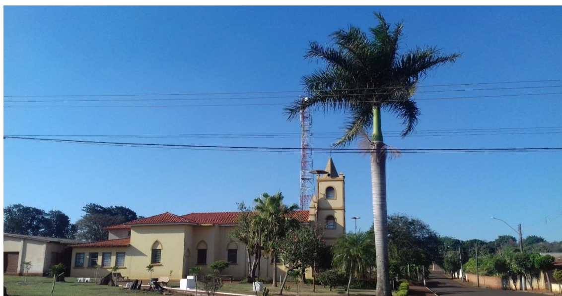
IMAGEM 8: Igreja Matriz do Distrito Frutal do Campo