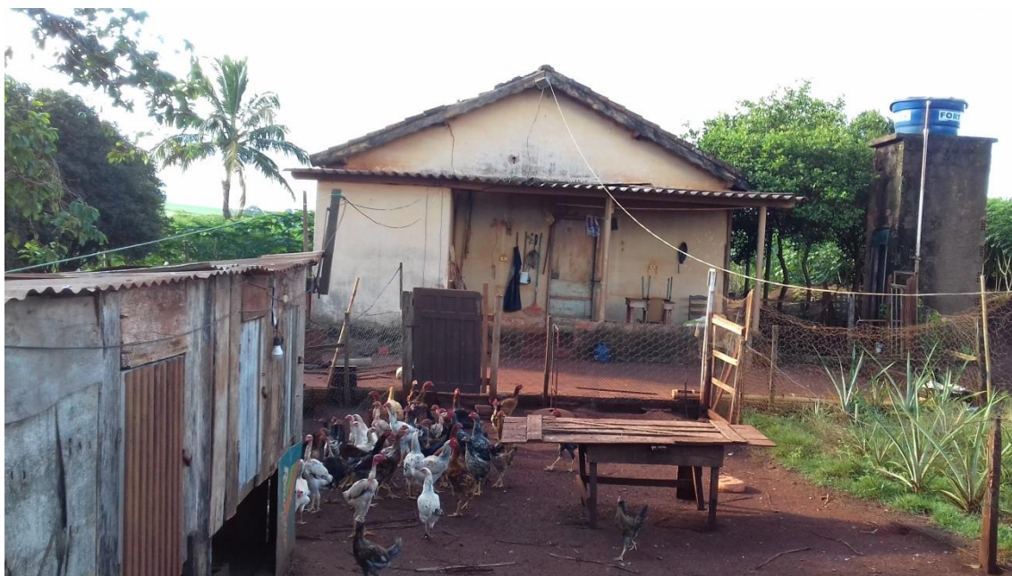
IMAGEM 31: Criação de galinhas.