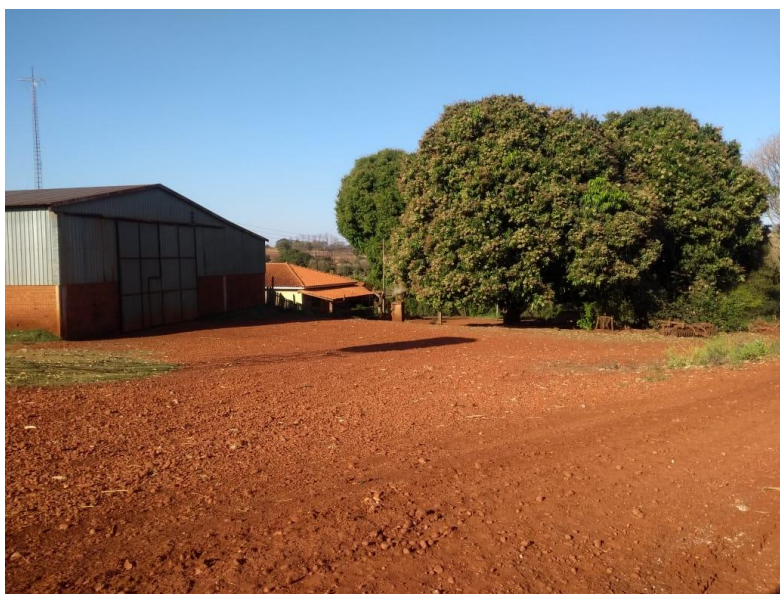
IMAGEM 21: Galpão dos maquinários e a casa da família Corrêa