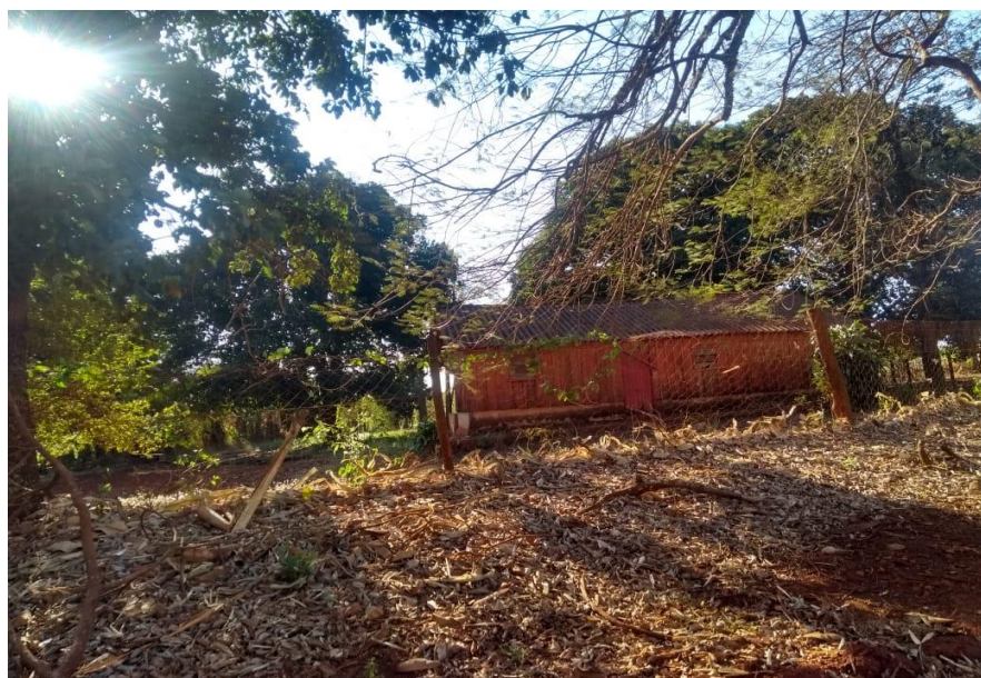
IMAGEM 12: Residência aparentemente abandonada