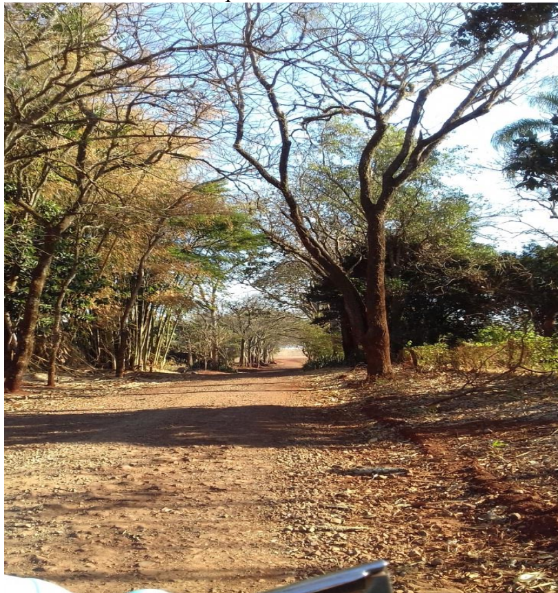
IMAGEM 11: Estrada que dá acesso às casas dos moradores.