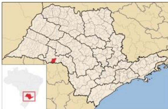
Imagem 1 - Localização do Município de Cândido Mota no Estado de São Paulo.