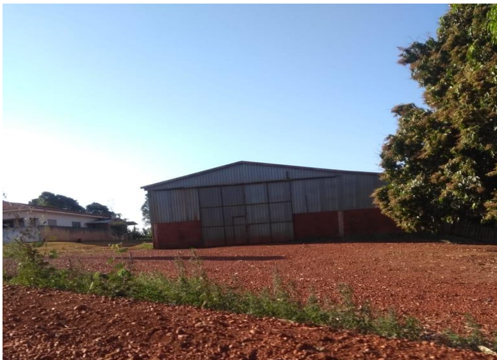
IMAGEM 23: Galpão dos maquinários