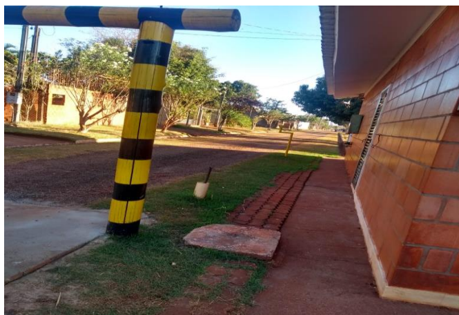
IMAGEM 18: entrada lateral do condomínio