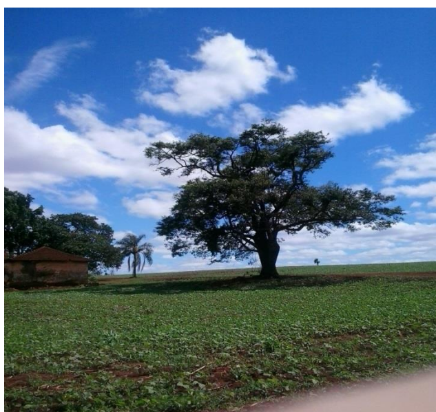
IMAGEM 26: Árvore centenária na propriedade do Senhor J.